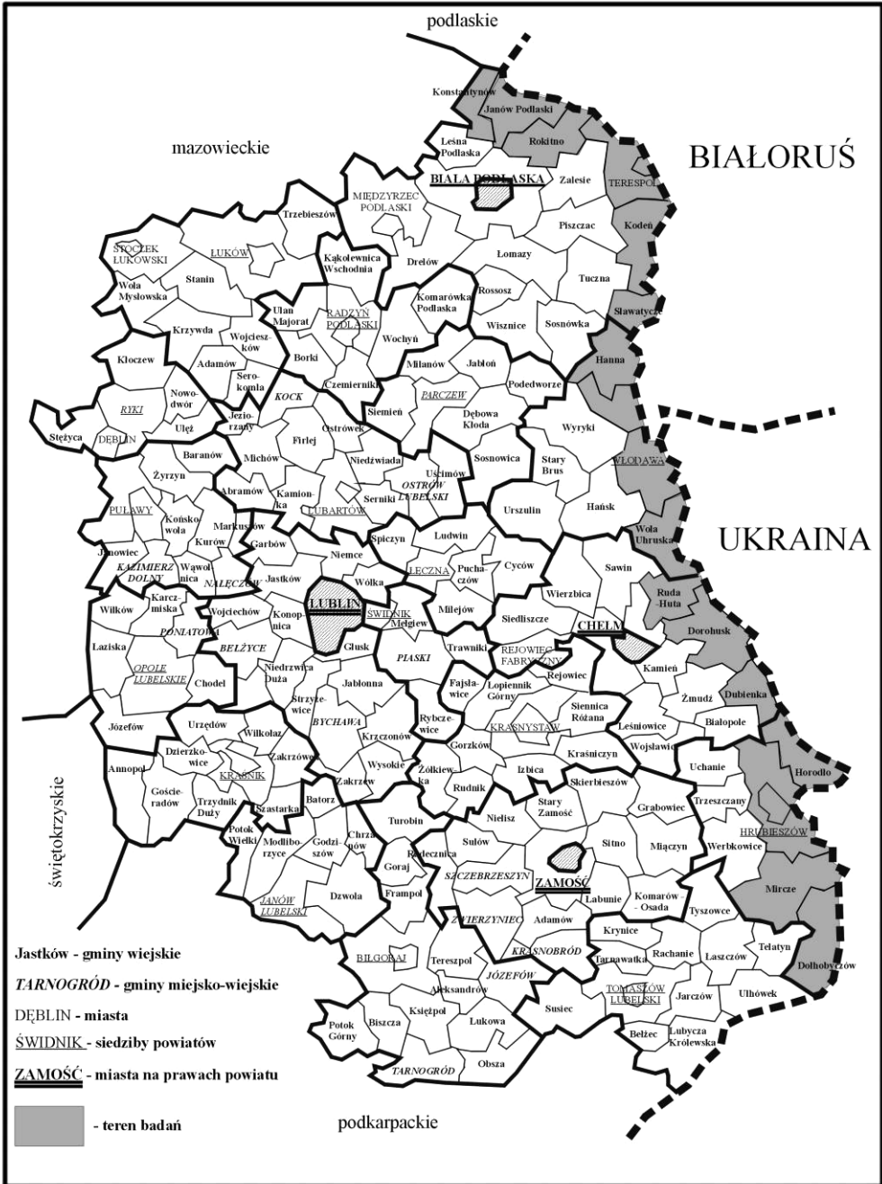
Ryc. 1. Gminy nadbużańskie województwa lubelskiego Fig. 1. Bug River Valley gminas of Lublin voivodship