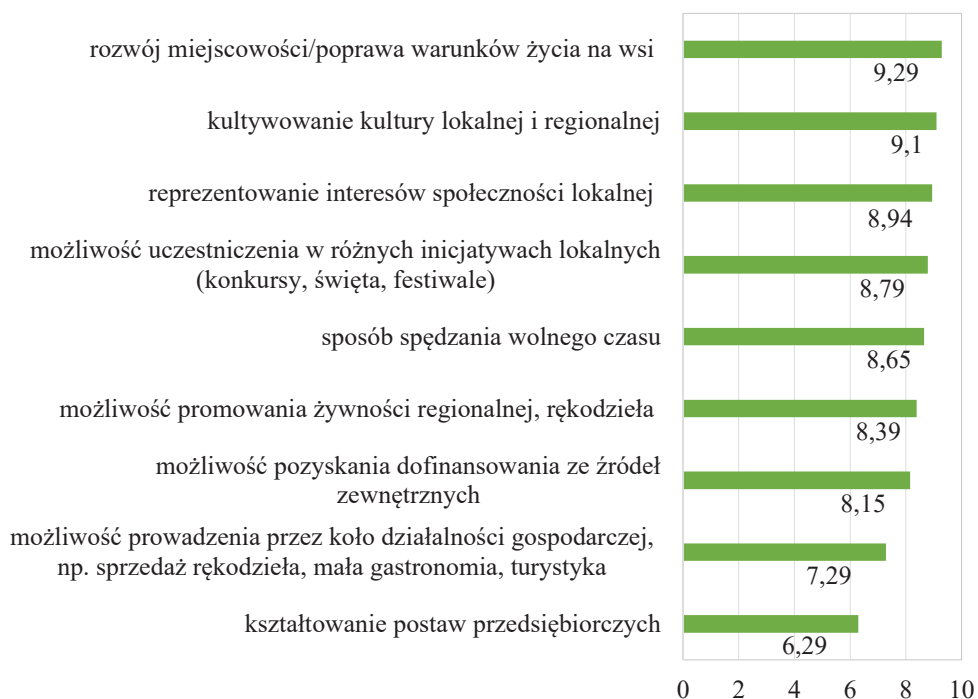
Rysunek 2. Motywy przystępowania do KGW (skala od 0 do 10)