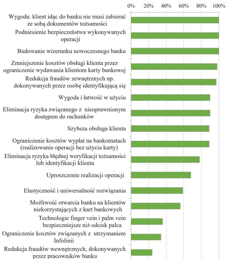
Rysunek 1. Wymieniane korzyści z wdrożenia technologii biometrycznej finger vein lub palm vein w opinii kadry menedżerskiej w badanych bankach spółdzielczych w Polsce

z sobą dokumentu tożsamości, budowanie wizerunku nowoczesnego banku oraz podniesienie bezpieczeństwa wykonywanych operacji [Pawęda 2018].