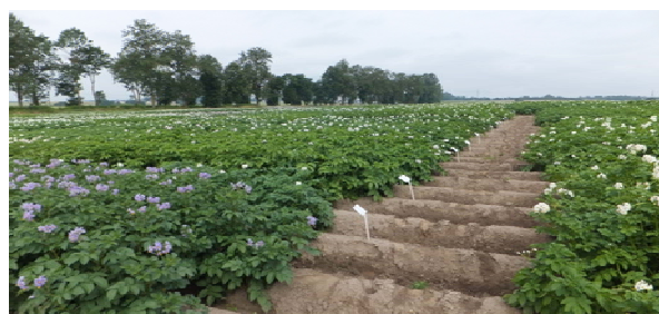
Fot. 1. Kolekcja polowa ziemniaka tetraploidalnego w Boninie

bulw, głębokość oczek), ze szczególnym uwzględnieniem ważnych cech jakości w hodowli nowych odmian jadalnych.