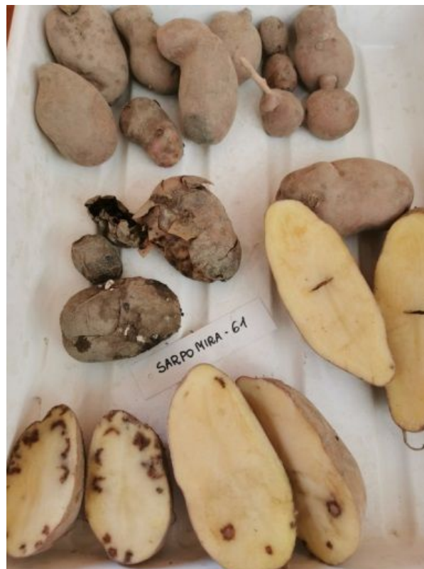
Fot. 2. Wady wewnętrzne i zewnętrzne bulw odmian Agria i Sarpo Mira w roku 2020 (B. Tatarowska)