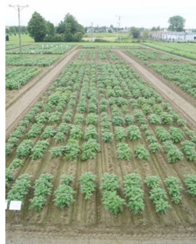
Fot. 6. Ocena porażenia odmian ziemniaka na P. infestans w warunkach naturalnej presji infekcyjnej w Boguchwale

Prace hodowlane. Jednym z podstawowych założeń projektu jest stworzenie rodów hodowlanych wysokiej jakości, spośród których będą selekcjonowane odmiany odpowiednie dla produkcji ekologicznej. Dlatego w ramach projektu prowadzone są programy krzyżowań rozpoczynające nowy cykl hodowlany (fot. 7). W programach tych jako formy rodzicielskie wykorzystywane są zarówno odmiany wytypowane z kolekcji ba-