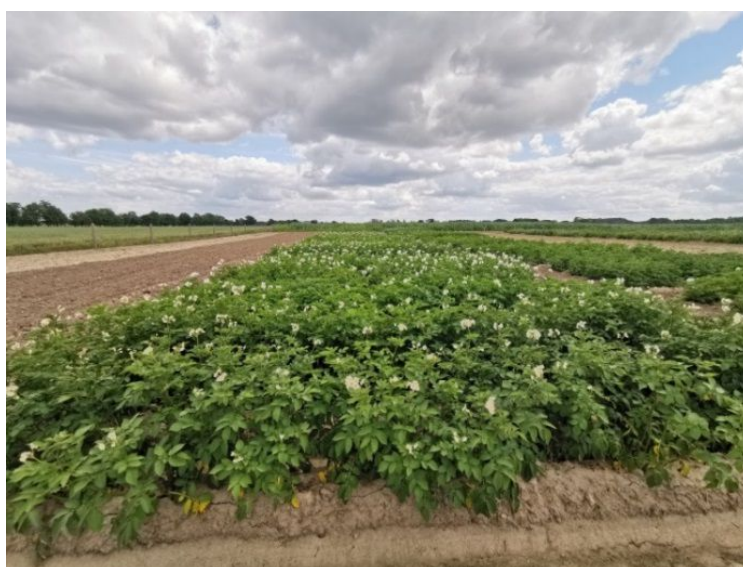
Fot. 1. Kolekcja 65 odmian ziemniaka na polu doświadczalnym w Młochowie (B. Tatarowska)

W sezonie wegetacyjnym odmiany z kolekcji oceniane są pod względem wzrostu roślin (wczesność wschodów, bujność roślin), barwy kwiatów, intensywności kwitnienia, porażenia roślin przez patogeny i szkodniki. Po zbiorze oceniany jest plon handlowy (w rozbiciu na trzy frakcje), plon skrobi oraz wielkość, regularność zarysu i kształt bulw. Prowadzone są bardzo szczegółowe oceny zewnętrznych i wewnętrznych wad bulw oraz stopień uszkodzeń powodowanych przez patogeny i szkodniki (fot. 2).