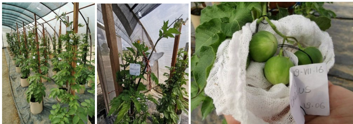
Fot. 7. Programy krzyżowań

zowej, jak i własne rody hodowlane charakteryzujące się wysokim poziomem odporności na P. infestans . W potomstwie pochodzącym z tych krzyżowań prowadzona jest selekcja materiałów hodowlanych odpowiednich do produkcji ekologicznej. Bardzo ważnym elementem tej selekcji jest wykorzystanie markerów molekularnych sprzężonych z genami odporności ziemniaka na P. infestans .