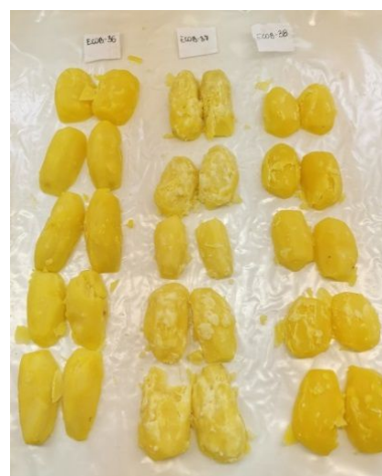
Fot. 3. Próby smakowe bulw