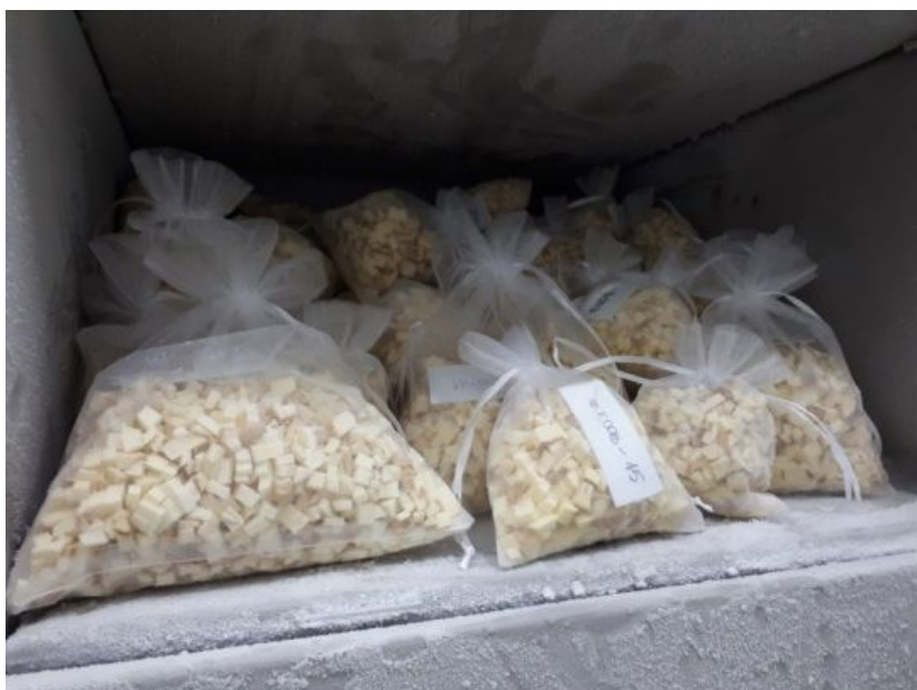
Fot. 5. Przygotowywanie próbek do oceny zawartości karotenoidów w bulwach ziemniaka