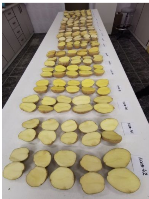
Fot. 4. Ocena ciemnienia bulw surowych po 10 minutach (B. Tatarowska)

Ponadto bulwy odmian znajdujących się w kolekcji oceniane są pod kątem całkowitej zawartości karotenoidów (TC) (fot. 5). Ziemniaki o podwyższonej zawartości karotenoidów są obiektem wzrastającego zainteresowania zarówno konsumentów, jak i hodowców. Mogą bowiem posłużyć jako źródło większej wartości odżywczej bulw, co jest szczególnie pożądanym u odmian przeznaczonych do upraw ekologicznych, nastawionych na uzyskiwanie bulw o wysokich walorach prozdrowotnych. Dlatego dokładna analiza form rodzicielskich nowych odmian pod kątem składu chemicznego bulw stała się ważnym elementem ich charakterystyki.