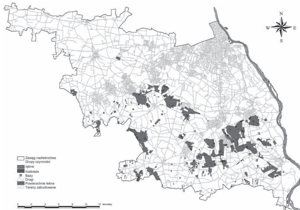
Rysunek 2. Kompleksy leśne z wyznaczonymi zadaniami w przykładowym nadleśnictwie

Figure 2. General economic assignment plan for exemplary forest district