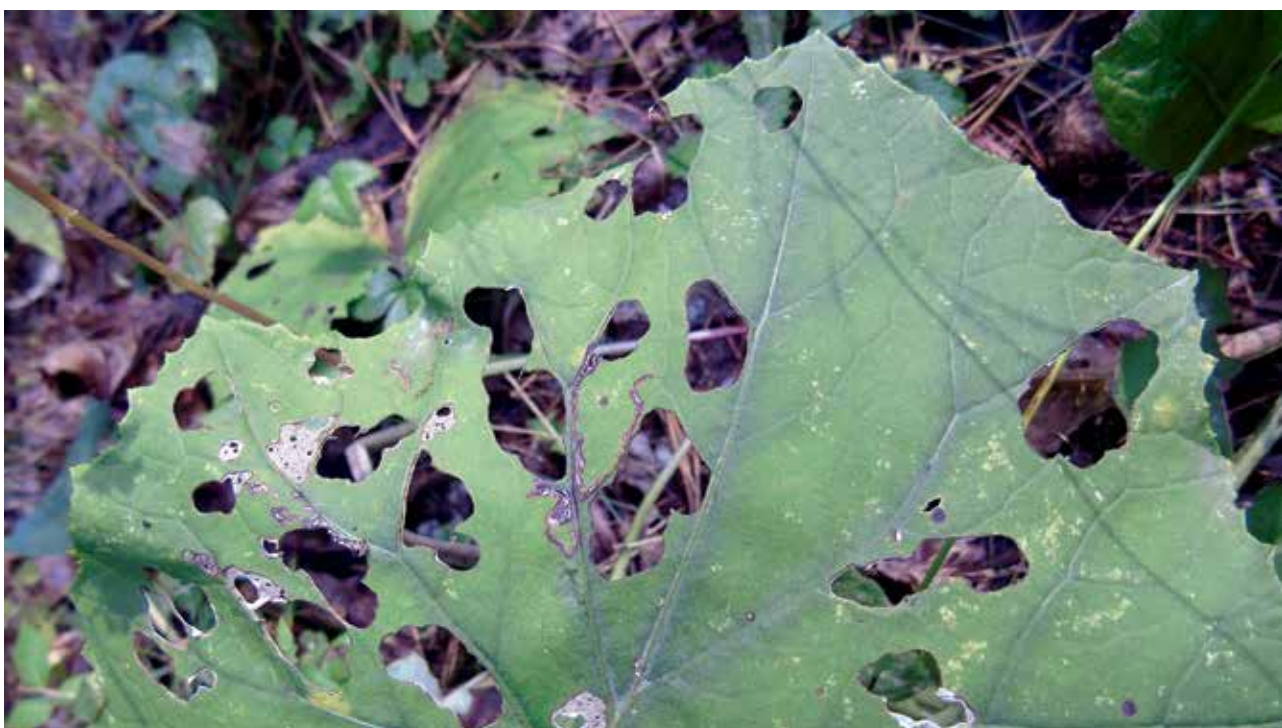
Ryc. 6. Perforacje w minach komorowych.

Miny komorowe powstają wówczas, gdy larwa minująca drąży krótkie korytarze przylegające do siebie, które po wydrążeniu zlewają się w jeden