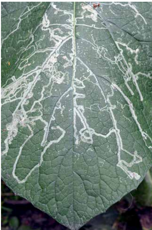
Ryc. 5. Liść łopianu pajączynowatego z minami korytarzowymi.

miny przyjmuje formę tunelu, a część – szerokiej komory). Miny korytarzowe powstają wówczas, gdy larwa żerując w blaszce liściowej posuwa się stale do przodu. Pozostawia za sobą wąski tunel, tzw. korytarz. Żerujące w ten sposób minowce, mogą drążyć takie miny na dwa sposoby. Niezależnie od unerwienia liści (nerwacji liściowej) powstają miny korytarzowe niezależne od unerwienia (Ryc. 1, 3). Jako przykład mogą posłużyć miny drążone w liściu niecierpka drobnokwiatowego czy miny w liściu gajowca żółtego. Larwy mogą również drążyć miny zależne od unerwienia liści. Powstają wtedy miny korytarzowe przylegające do nerwów liściowych (Ryc. 2). Korytarze układają się wyraźnie wzdłuż nerwu głównego i odchodzących od niego do poszczególnych nerwów bocznych danej rośliny. Miny korytarzowe mogą mieć różny przebieg: prosty – gdy żerująca larwa posuwa się naprzód i kręty – gdy żerująca larwa wykonuje skręty w różnych kierunkach. Nierzadko takie miny zachodzą na siebie tworząc swoistą komorę. Takie miny możemy zaobserwować w liściu łopianu czy niecierpka. Wydrążony korytarz (chodnik) może być ślimakowato skręcony lub silnie powyginany. Poszczególne odcinki korytarza mogą wzajemnie do siebie przylegać lub rozgałęziać się na wszystkie strony, tworząc mozaikę korytarzy jak na liściu łopianu pajączynowatego (Ryc. 5).