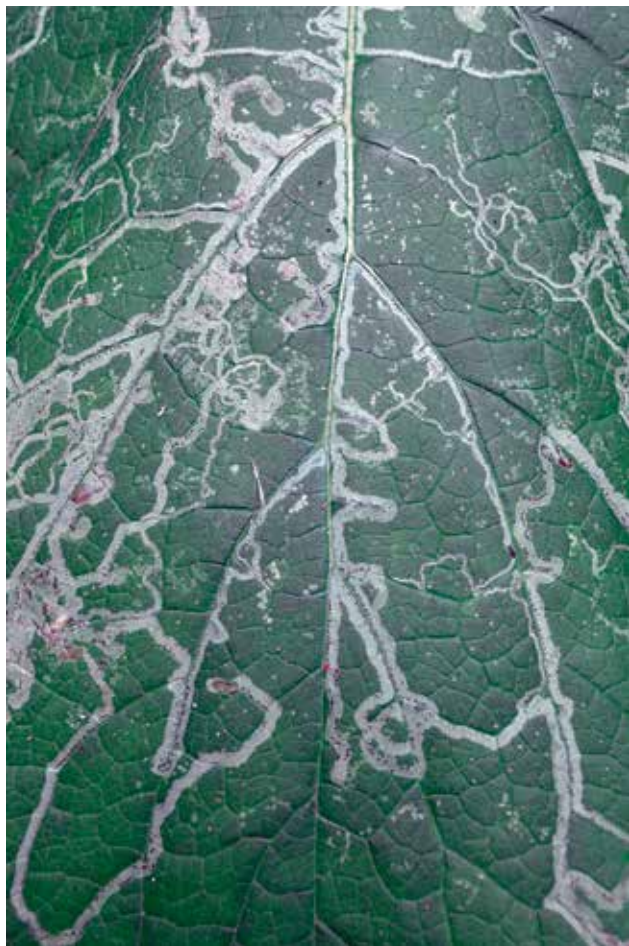
Ryc. 2. Mina korytarzowa drążona zależnie od unerwienia.

barwę szklistobiałą. Zwykle na liściu widoczna jest jako przezroczysta, kręta i wąska ścieżka. Z czasem może ona brązowieć. Dzieje się tak pod wpływem rozkładu i zasychania szczątków uszkodzonych