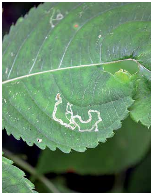
Ryc. 1. Mina korytarzowa drążona niezależnie od unerwienia.

Zapewne wielu z was widziało w liściach roślin ścieżki w kształcie nieregularnych poskręcanych plam. Te ślady zwane są minami i powstają wskutek żerowania larw szkodników. Atakujące minowce, nazywane też owadami minującymi, są okresowymi (larwalnymi) pasożytami wewnętrznymi roślin. Należą do nich niektóre błonkówki, motyle, muchówki i chrząszcze. Zwykle „atakują” dziko rosnące rośliny naczyniowe. Zaatakowanymi organami tych roślin są najczęściej liście. Larwy owadów minujących żerują w miększu liściowym, drążąc w nim chodniki różnej długości, szerokości i wielkości. Takie ślady ich działalności często są widoczne na zewnątrz w postaci łatwo zauważalnych, białych wężkowatych pasm, smug lub plam. Określono je terminem min, który oznacza „korytarz lub komorę drążoną przez larwę owada minującego we wnętrzu żywych tkanek miększu lub skórki, izolowaną z zewnątrz przynajmniej zewnętrzną ścianą skórki lub kutikulą”. Wydrążone miny są charakterystyczne dla poszczególnych gatunków owadów minujących i na podstawie ich wyglądu można oznaczyć owada minującego. Minowce najczęściej drążą swe korytarze (miny) w obu warstwach miększu liścia: palisadowym i gąbczastym. Taka wydrążona mina jest obustronna i przyjmuje