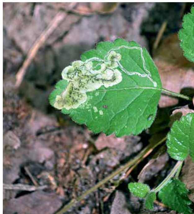
Ryc. 4. Typowa mina korytarzowo-komorowa w liściu gajowca żółtego.

ruje w skórce tylko we wczesnym stadium rozwoju, a następnie przechodzi do miękiszu palisadowego i gąbczastego. W zależności od sposobu drążenia poszczególnej miny wyróżniamy różne ich typy (rodzaje), tj. miny korytarzowe, miny komorowe oraz miny korytarzowo-komorowe (gdzie część wydrążonej