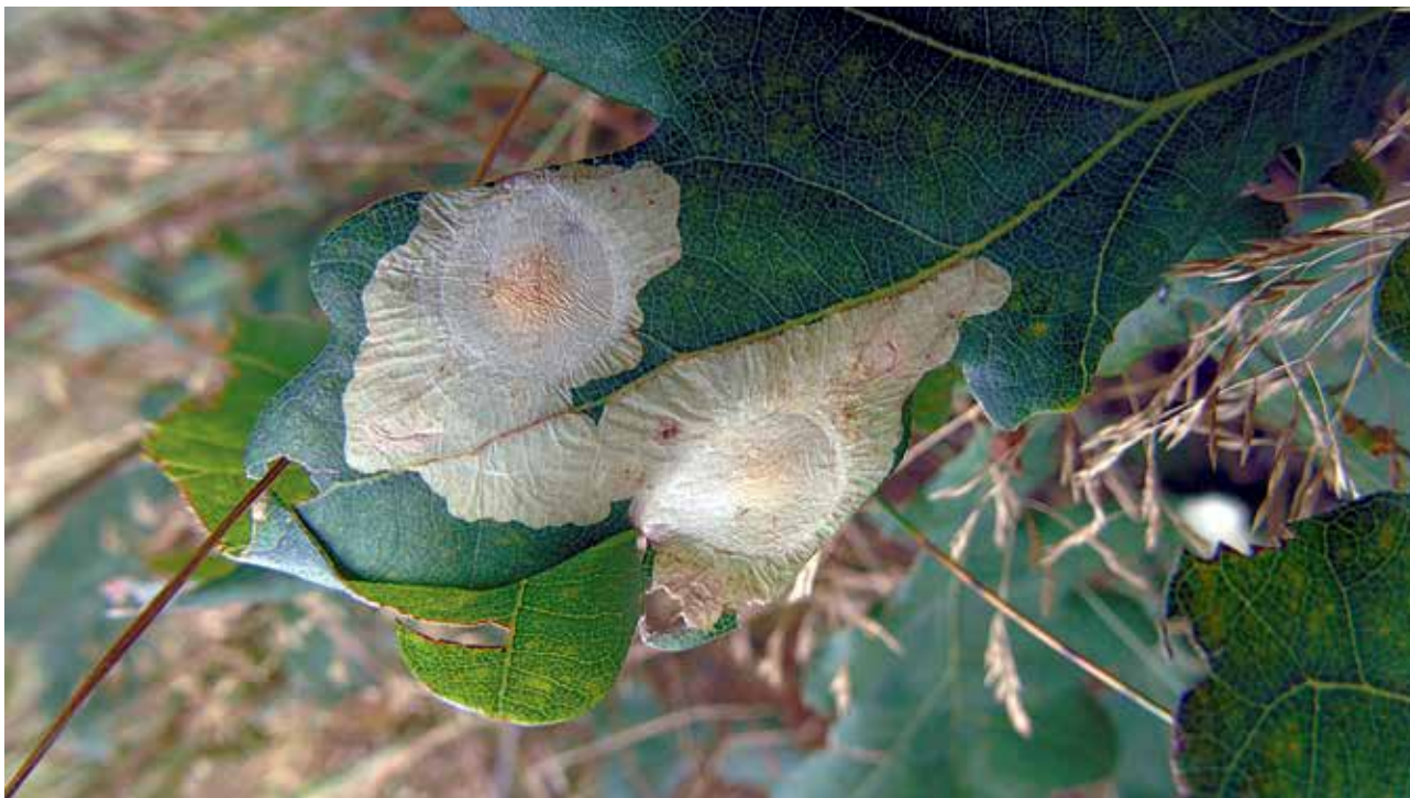
Ryc. 7. Mina z pęcherzasto wzdętymi komorami w liściu dębu.

Warto zaznaczyć, że w każdej z min larwy bytują tak długo, jak długo mają zapewnioną bazę pokarmową, a więc dostępny dla nich mięksiz. Drażąc korytarze zostawiają za sobą „łańcuszek” odchodów, który widzimy w postaci czarnych czy brązowych grudek. W naturze spotykamy miny bezbarwne, tzw. „szkliste”, wypełnione czarnymi grudkami.