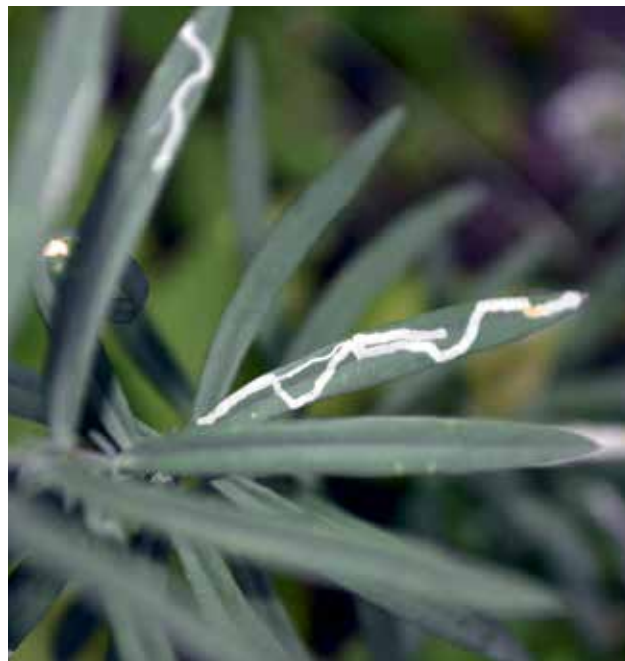
Ryc. 3. Mina korytarzowa w liściu Inicy pospolitej.

Noszą one nazwę min epidermalnych (epiderma – skórka). W naturze takie miny występują stosunkowo rzadko. Tylko nieliczne owady minują w skórce przez cały okres rozwoju larwalnego. Większość z nich że-