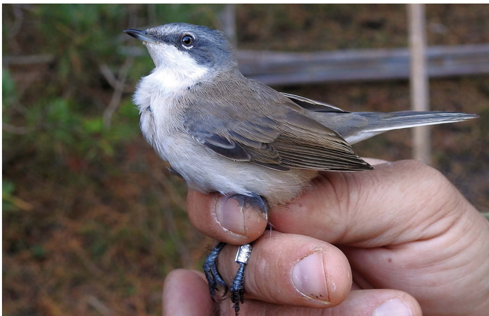
Fot. 13. „Piegża syberyjska” Curruca curruca blythi , Dąbkowice, październik–listopad 2019 – „Siberian Lesser Whitethroat”, Dąbkowice, October–November 2019