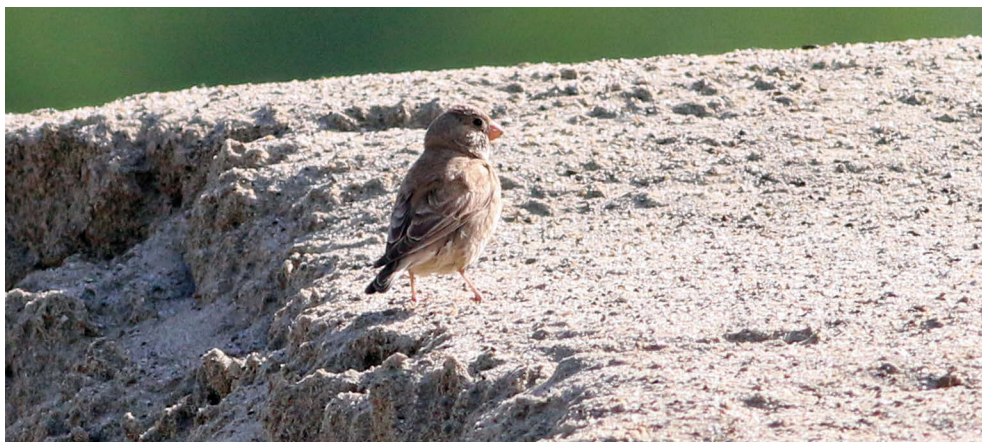
Fot. 21. Gilak pustynny Bucanetes githagineus , Wrocanka, maj 2022 – Trumpeter Finch, Wrocanka, May 2022

✧ Pierwsze stwierdzenie w kraju (Guzik 2023).