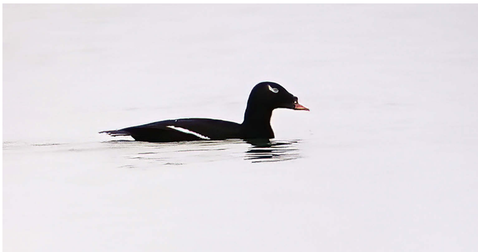
Fot. 1. Uhla azjatycka Melanitta stejnegeri , Krynica Morska, listopad 2022 – Siberian Scoter, Krynica Morska, November 2022

Uhla azjatycka Melanitta stejnegeri 2/2, 4/5 POMORSKIE: 13.11.22. – 2 ♂♂ ad. (foto), Krynica Morska, pow. nowodworski (A. Kaniewska-Skoczylas, K. Skoczylas, www.clanga.com); 15.11.22. – 1 ♂ ad. (fot. 1), tamże (A. Kuźnia, T. Kozakiewicz); 17.12.22.–28.02.23. – 1 ♂ ad. (foto), tamże (A. Kuźnia i inni); 15.11.22. – 1 ♂ ad. (foto), Władysławowo, pow. pucki (Z. Kajzer, M. Sołowiej). ✧ Analiza kształtu narośli na dziobach poszczególnych osobników wykazała, że jesienią 2022 na wodach Zatoki Gdańskiej i we Władysławowie przebywały cztery różne osobniki.