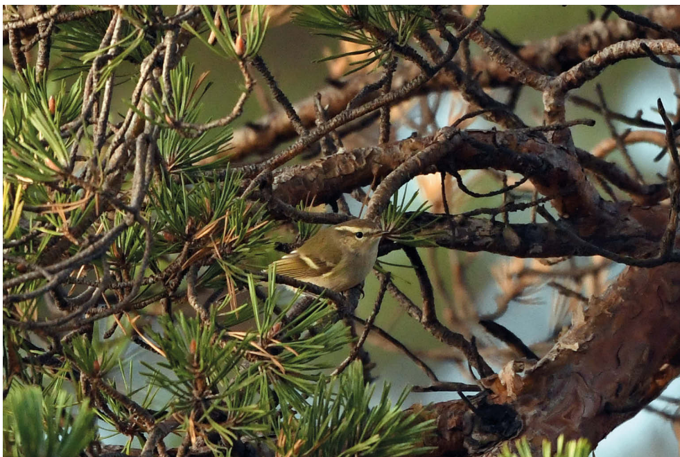
Fot. 11. Świstunka altajska Phylloscopus humei , Jurata, październik 2022 – Hume's Warbler, Jurata, October 2022