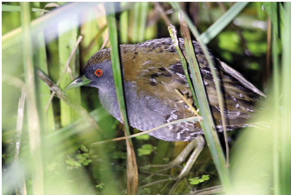
Fot. 2. Karliczka Zapornia pusilla , Puszcza Goleniowska, czerwiec 2022 – Baillon's Crake, Goleniowska Forest, June 2022

✧ W roku 2022 ponownie odnotowano karliczki, które stwierdzono na trzech stanowiskach na Pomorzu Zachodnim. Choć niektóre samce były stacjonarne, to legów nie potwierdzono.