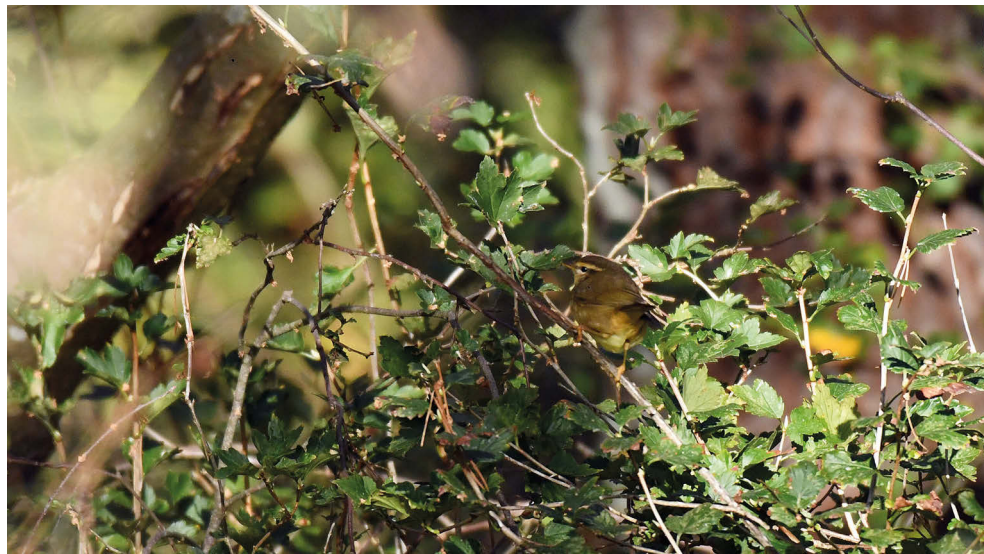
Fot. 12. Świstunka grubodzioba Phylloscopus schwarzi , Krynica Morska, październik 2022 – Radde's Warbler, Krynica Morska, October 2022

✧ Pierwsze stwierdzenie od roku 2016 (Stawarczyk et al. 2017).