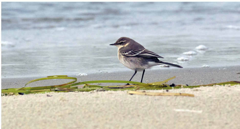
Fot. 20. Pliszka syberyjska Motacilla tschutschensis , Hel, wrzesień 2022 – Eastern Yellow Wagtail, Hel, September 2022