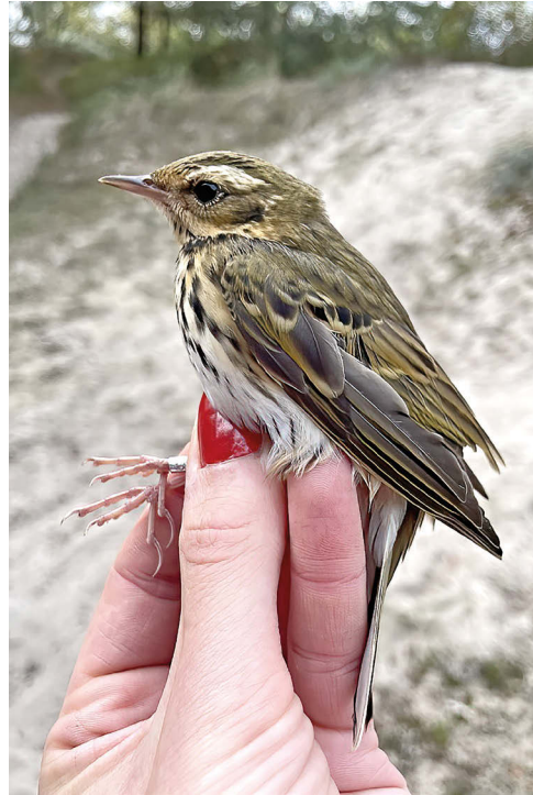
Fot. 19. Świergotek tajgowy Anthus hodgsoni , Dąbkowice, wrzesień 2022 – Olive-backed Pipit, Dąbkowice, September 2022

✧ Pierwszy przypadek schwywania tego gatunku.