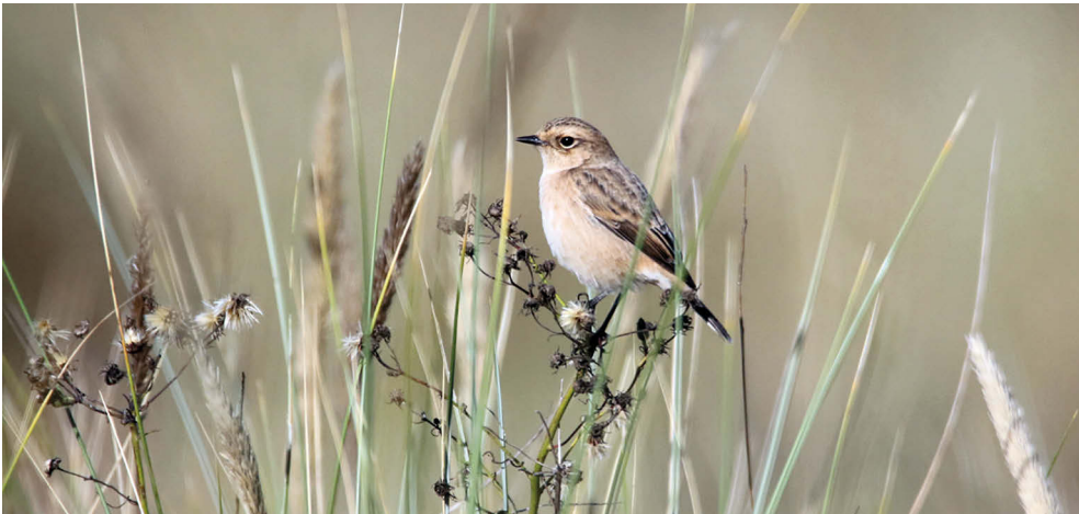
Fot. 16. Kłaskawka syberyjska Saxicola maurus , Hel, wrzesień 2022 – Siberian Stonechat, Hel, September 2022

✧ Identyfikacja osobnika z Władysławowa została potwierdzona analizą materiału genetycznego (M. Collinson in litt.). Komisja przyjęła szwedzkie kryteria akceptacji ptaków bez badań DNA w przypadku osobników bardzo dobrze sfotografowanych i wykazujących cechy spoza strefy pokrywania się zasięgu S. maurus i S. stejnegeri (Hellström & Waern 2023).