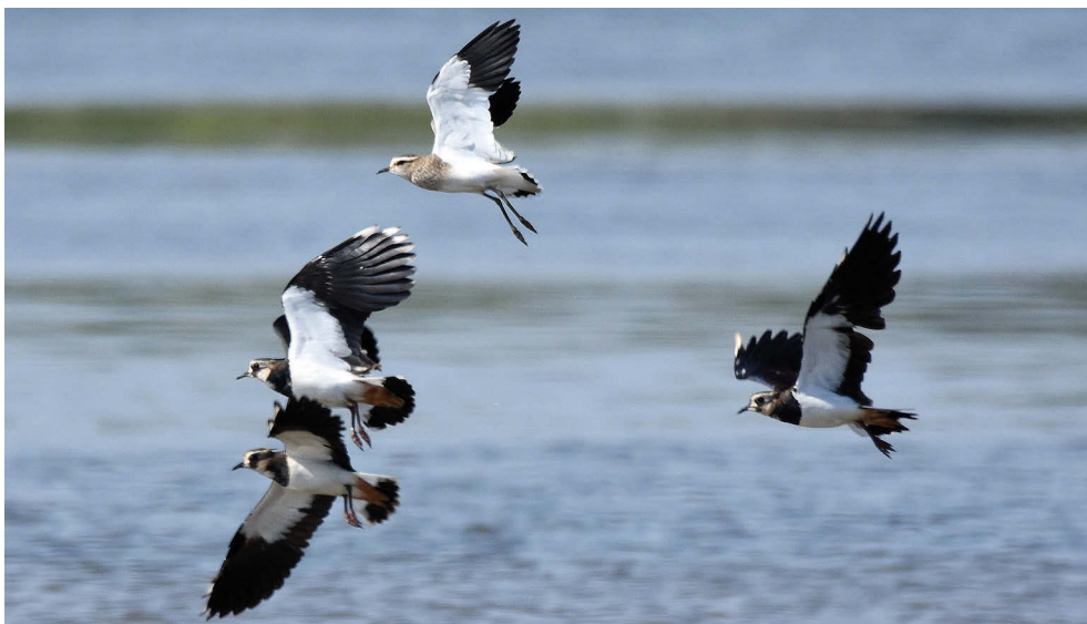
Fot. 4. Czajka towarzyska Vanellus gregarius , Wólka Zatorska, sierpień 2022 – Sociable Lapwing, Wólka Zatorska, August 2022

Czajka towarzyska Vanellus gregarius 61/63, 5/5 MAŁOPOLSKIE: 01.10.22. – 1 os. (foto), Biskupice Radłowskie, pow. tarnowski (T. Folta).