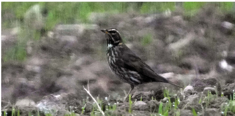
Fot. 18. „Droździk islandzki” Turdus iliacus coburni , Dzierżanów, Październik 2022 – „Icelandic Redwing”, Dzierżanów, October 2022

✧ Pierwsze stwierdzenie tego islandzkiego podgatunku w kraju.