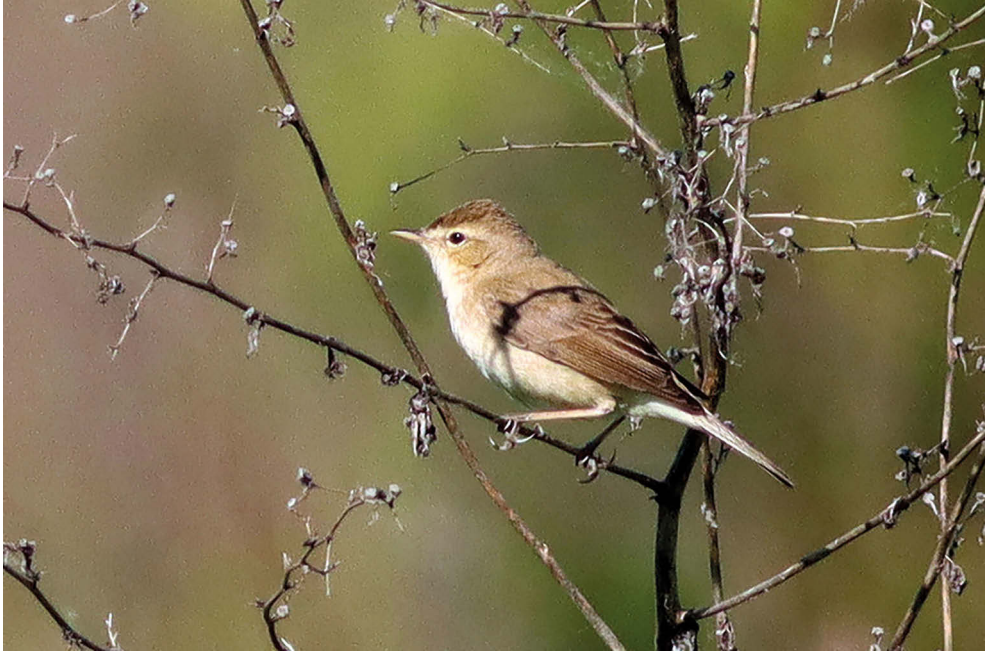
Fot. 10. Zaganiacz mały Iduna caligata , Białystok Krywlany, czerwiec 2022 – Booted Warbler, Białystok Krywlany, June 2022

✧ Przyjęto, że w czerwcu na Helu przybywały trzy osobniki, przy czym jednocześnie 04.06.22. widziano dwa ptaki. Liczba stwierdzeń mogła być wyższa, ale jest to trudne do ustalenia.