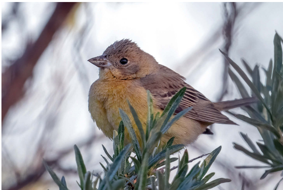
Fot. 23. Trznadel czarnogłowy Emberiza melanocephala , Hel, czerwiec 2022 – Black-headed Bunting, Hel, June 2022

POMORSKIE: 05.06.22. – 1 ♀ (fot. 23), Hel, pow. pucki (S. Beuch i inni).