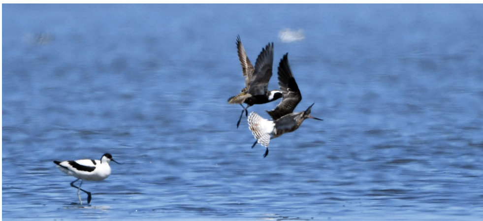
Fot. 3. Siewka szara Pluvialis dominica , Zalew Szczeciński, czerwiec 2022 – American Golden Plover, Szczecin Lagoon, June 2022

Siewka złotawa Pluvialis fulva lub siewka szara Pluvialis dominica 5/5, 1/1 MAŁOPOLSKIE: 19.12.22. – 1 juv. (foto), Rusosice i Łączany, pow. krakowski i wadowicki (A. i A. Mikrut).