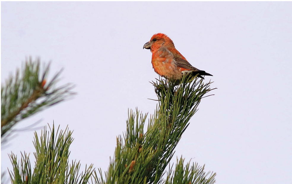
Fot. 22. Krzyżodziób sosnowy Loxia pytyopsittacus , Krynica Morska, październik 2022 – Parrot Crossbill, Krynica Morska, October 2022

✧ Najliczniejszy nalot w czasach współczesnych (Stawarczyk et al. 2017), odnotowany przede wszystkim na wybrzeżu.