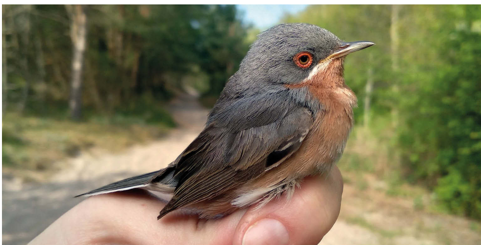
Fot. 14. Pokrzewka iberyjska Curruca iberiae , Bukowo, maj 2022 – Western Subalpine Warbler, Bukowo, May 2022