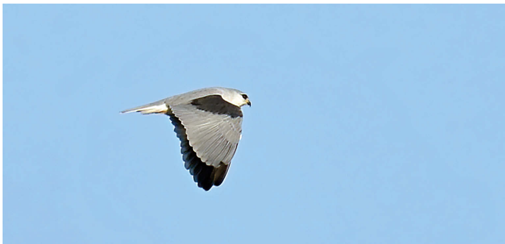
Fot. 7. Kaniuk Elanus caeruleus , Ciecierzycze, wrzesień 2022 (M. Koitka) – Black-winged Kite , Ciecierzycze, September 2022

LUBUSKIE: 13.09.22. – 1 ad. (fot. 7), Ciecierzycze, pow. gorzowski (M. Koitka).