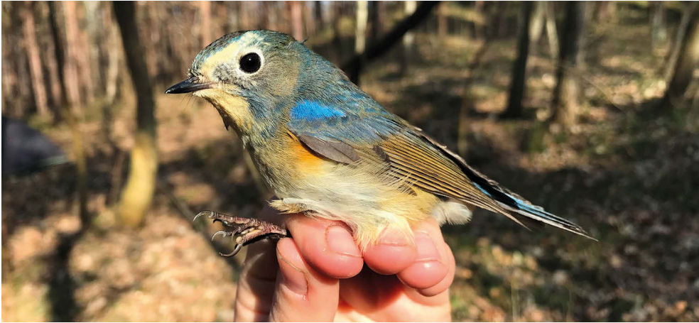
Fot. 15. Modraczek Tarsiger cyanurus , Kuźnica, marzec 2022 – Red-flanked Bluetail, Kuźnica, March 2022

✧ Trzecie i najwcześniejsze stwierdzenie wiosenne.