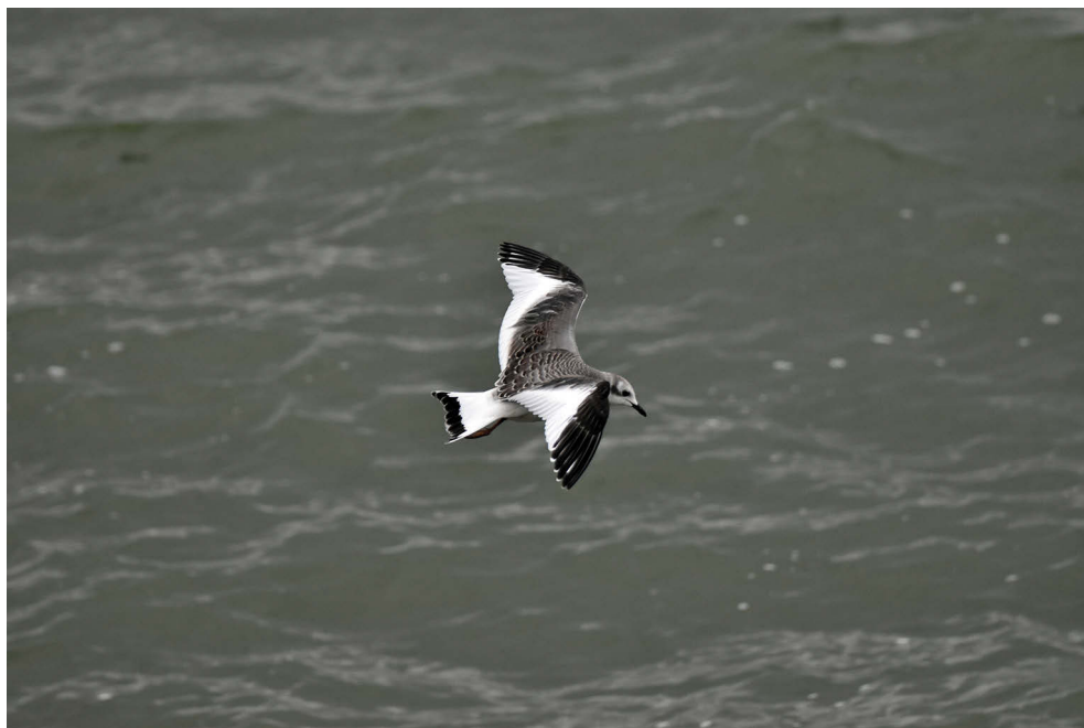
Fot. 5. Mewa obrożna Xema sabini , Zb. Goczałkowicki, wrzesień 2022 – Sabine's Gull , Goczałkowicki Reservoir, September 2022