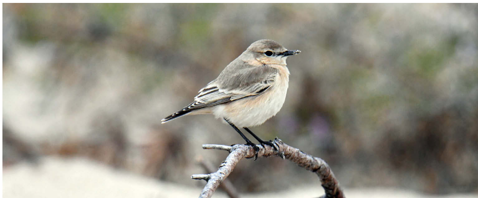
Fot. 17. Białorzytka płowa Oenanthe isabellina , Hel, wrzesień 2022 – Isabelline Wheatear, Hel, September 2022

POMORSKIE: 28.09.22. – 1 os. (fot. 17), Hel, pow. pucki (T. Doroń, Y. Shashenko, S. Sendera i inni).