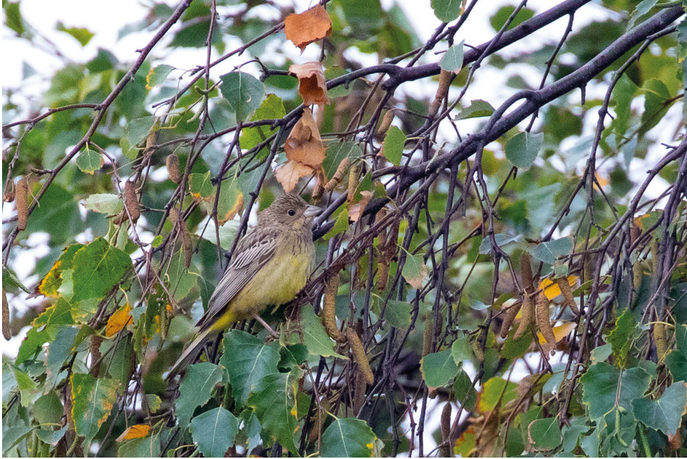
Fot. 24. Trznadel rudogłowy Emberiza bruniceps , Hel, czerwiec 2022 – Red-headed Bunting, Hel, June 2022