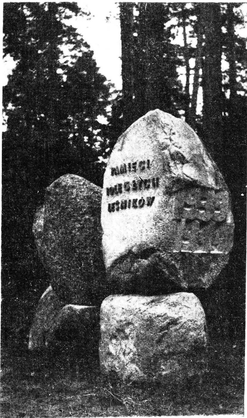
Rys. 2. Fragment pomnika poświęconego pamięci leśników

W uroczystości wzięło udział kilka tysięcy osób, wśród nich przedstawiciele organizacji politycznych oraz wojewódzkich i powiatowych władz administracyjnych. W toku uroczystości przewodniczący Polskiego Towarzystwa Leśnego wygłosił podane poniżej przemówienie.