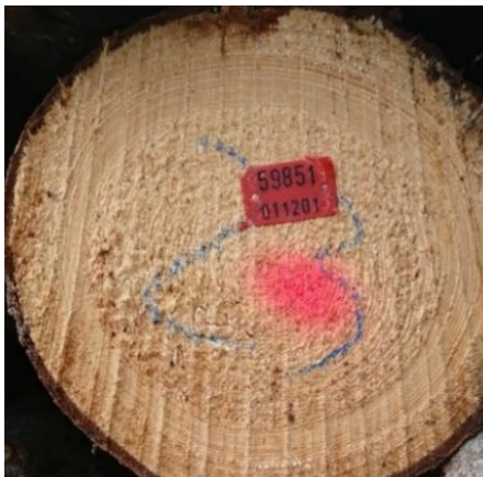
Rysunek 3. Ocechowany sortyment za pomocą płytki

Figure 3. Marked assortment by means of a plate