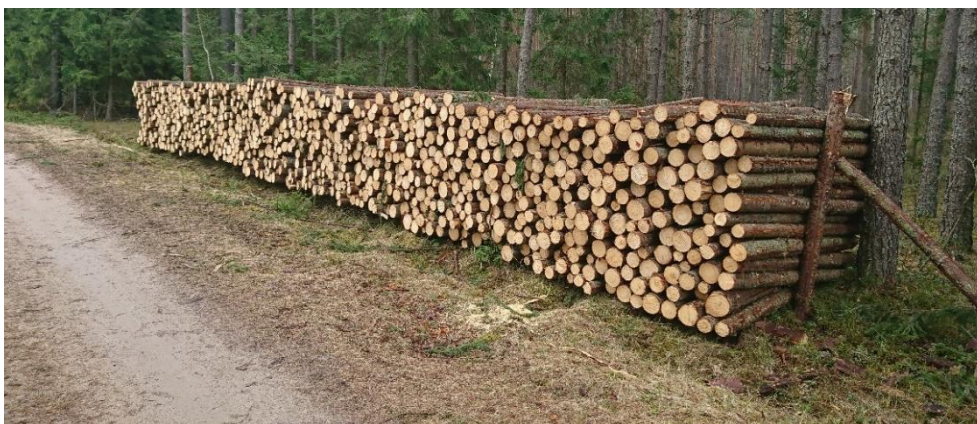
Rysunek 2. Drewno S2A składowane w stosie z podporami bocznymi Figure 2. S2A timber stacked with side supports