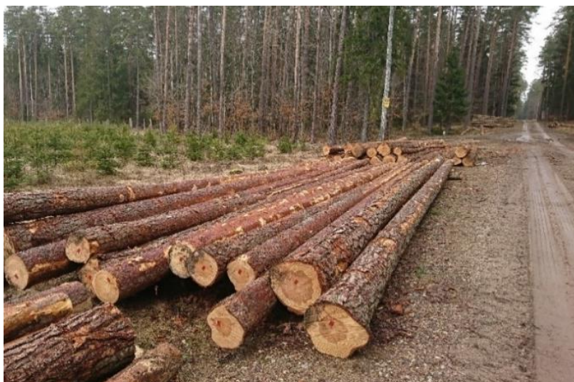
Rysunek 4. Drewno WC0 składowane przy drodze wywozowej, mierzone w sztukach pojedynczo

Figure 4. WC0 wood stored next to the export road, individually measured in pieces