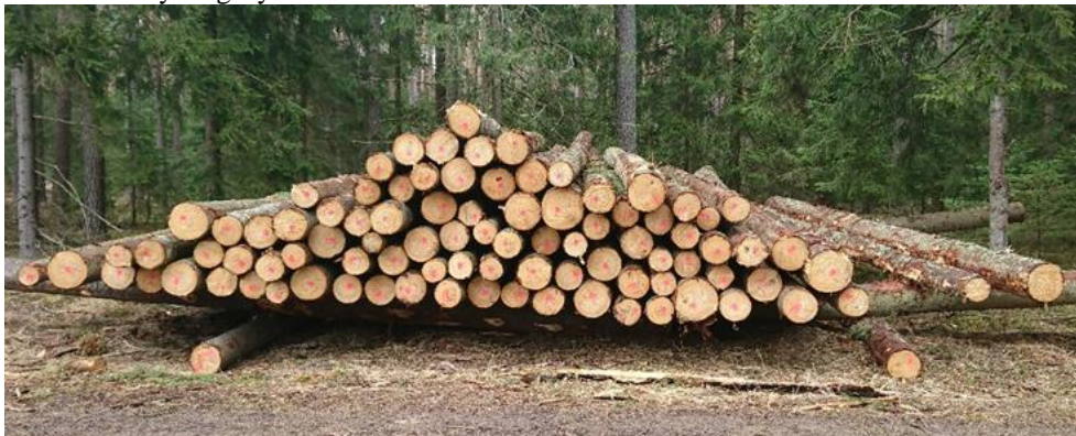
Rysunek 1. Drewno WCKG składowane w stosie z legarami w kształcie „kołyski”, mierzone w sztukach grupowo Figure 1. WCKG wood stored in a pile with cradle-shaped joists, measured in pieces in group

pozyskanego drewna, w sztukach lub stosach, są wprowadzane do rejestratora i na tej podstawie tworzą rejestr odbioru drewna, który później stanie się dokumentem potwierdzającym aktualne stany magazynowe.