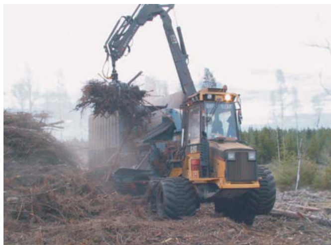
Rys. 1. Agregat zrębkujący Bruks 804CT Fig. 1. Mobile chipper Bruks 804CT

rzynki kłód i wyrzynków wartość wydajności pracy (pracochłonności) dotycząca pozostałości zrębowych ustalono przez pomnożenie wydajności tych operacji przez udział pozostałości zrębowych w całej pozyskanej biomase. Podobnie w przypadku zrywki drewna okrągłego, koniecznej do realizacji zrywki pozostałości zrębowych z powierzchni.