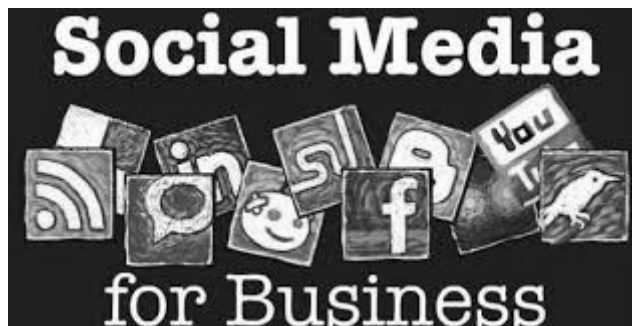
Rys. 2. Media społecznościowe w XXI wieku.

środków przepływu informacji dał możliwość szybszego przepływu informacji gospodarczej (m.in. szybszy kontakt handlowy, szybsze negocjowanie kontraktów), co w latach dziewięćdziesiątych XX wieku przyczyniło się do ogromnego wzrostu inwestycji zagranicznych, bowiem odległość przestała być problemem.