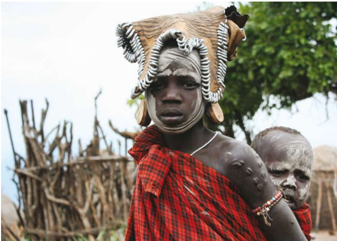
Ryc. 7. Coraz częściej kobiety Mursi nie poddają się zwyczajowi rozszczepiania wargi.

( Cosypha niveicapilla ), sułtanka afrykańska ( Prophyrion alleni ) czy sierpodudek kenijski ( Phoeniculus damarensis ). Z brodzących wyróżnia się czapla zielona ( Butorides stratus ), w trawiastych siedliskach by-