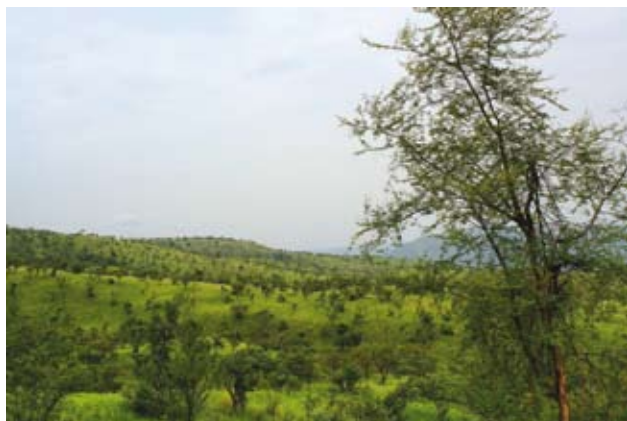
Ryc. 2. Typowy krajobraz wnętrza PN Mago.

nujących starodawny tryb życia. O niektórych mówi się, że są jednymi z ostatnich w Afryce, reprezentującymi przedkolonialne formy społeczne. Ukośnie przecina Etiopię potężny rów tektoniczny, ciągnący się z głębi Afryki aż po Syrię, zwany Wielkim Riftem (jego część to Rów Abisyński). Ku Morzu Czerwonemu i Zatoce Edeńskiej rozszerza się on lekko w Kotlinę Danakijską, oddzieloną od mórz Górami Danakilskimi. Pomiędzy nią a granicą z Kenią powstało kilka wielkich jezior, przyciągających osadnictwo.