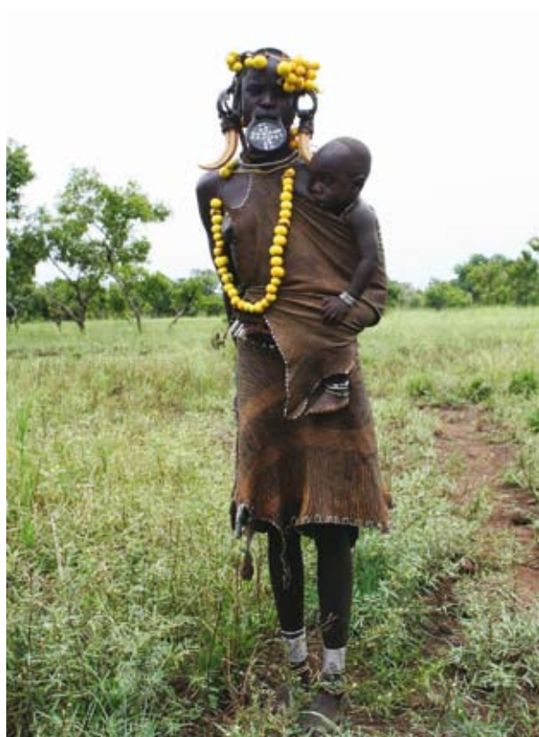
Ryc. 8. Kobieta Mursi z wargowym krążkiem. wręcz, by zrobić mu zdjęcie (by uzyskać opłatę), albo co najmniej dać pieniądze. Świadomość, że to właśnie biali turyści do tego doprowadzili, niewiele pomaga. Uciekaliśmy po kwadransie, woląc rozglądać się po krajobrazach i za zwierzętami. Tak czy inaczej, Mursi również należą do środowiska.