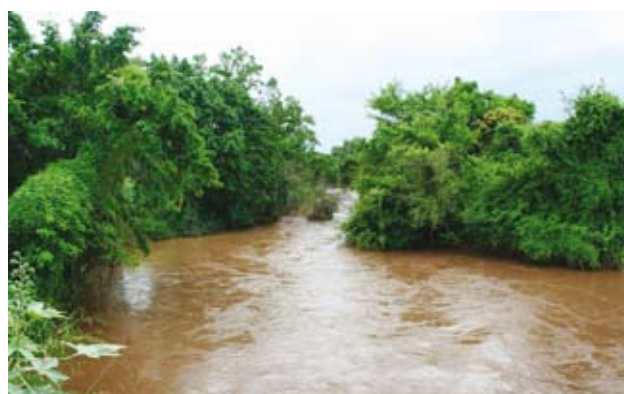
Ryc. 3. Rzeki są brązowe nie tylko po deszczach.

on 789 km na południe od Addis Abeby, 115 km na północ od Omorate przy granicy kenijskiej i 26 km na południowachód od Džinki (Jinki), gdzie mieści się bardzo skromna siedziba dyrekcji Parku. Po zmianach w 1979 r. jego granice obejmują 2162 km 2 i stykają się z jeszcze większym PN Omo (4068 km 2 ), zaś w sąsiedztwie, od wschodu rozciąga się Stephanie Wildlife Reserve, chroniący dziką zwierzynę. Za rzeką Tama, od zachodu po rzekę Omo (Gibe), funkcjonuje Tama Wildlife Reserve, zaś od południa – Murle Controlled Hunting Area oddzielona przez jezioro Dipa nad dolnym Omo, gdzie wprawdzie można polować, ale w ściśle nadzorowany sposób. W ten sposób na znacznej powierzchni przy południowej granicy Etiopii stworzono ochronną przestrzeń o dość jednolitym charakterze ekologicznym. PN Mago ma wyrównany w zasadzie kształt, wchłaniający niejako