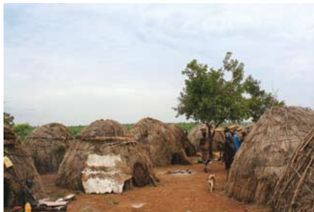
Ryc. 6. Wioska Mursi.

Stosownie do szerokości geograficznej i kontynentu przedstawia się skład miejscowej fauny. W Parku, zwłaszcza w jego południowo-zachodniej części żyją słonie (obecnie około 200 sztuk), choć ich populacja mocno zmalała wskutek zmian środowiska i polowań, w dużej mierze kłusowniczych. Podobnie jest z pogłowiem bawołów, których stada jeszcze nie tak dawno dochodziły do 1000 sztuk, a dziś szacowane są najwyżej na 400. Z innych większych ssaków, które też trudno spotkać, należy wymienić zebry i żyrafy – tych drugich obserwuje się dwa podgatunki: bardziej na zachód żyje tzw. żyrafa właściwa ( Giraffa camelopardalis camelopardalis ), bardziej zaś na południe – żyrafa siatkowana ( Giraffa camelopardalis reticulata ). Przy okazji warto wspomnieć o drugiej części nazwy gatunkowej, która powstała z połączenia słów camelus (wielbłąd) i panthera (lampart). Swojego czasu uważano bowiem na serio, że żyrafa