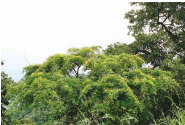
Ryc. 4. Akacja Farnesa.

pierwsza, obfitująca w opady, przypada na marzec i kwiecień, druga – nieco uboższa w nie, na październik i listopad) sięga średnio 800 mm. Nieco większe wartości notowane są w górach. W konsekwencji większość obszaru, w tym PN Mago, stanowią siedliska suche i półsuche, bogatsze w wodę jedynie w sąsiedztwie rzek. Te zaś praktycznie przez cały rok niosą wielkie masy brunatnej i czerwonej zawiesiny, pochodzącej z intensywnej denudacji latearytowych gleb, pozbawionych leśnej osłony. Warto zwrócić uwagę na rolę rzeki Omo, podobną do spełnianej przez Nil. Otóż po maksymalnych wezbraniach w sierpniu czy wrześniu rzeka ta wylewa na sąsiadujące poletka, pozostawiając na nich żyzny namuł. Ostatnie lata przynoszą wszelako poważne zakłócenia w tym naturalnym rytmie przyrody. Coraz częstsze, dłuższe i głębsze susze powodują bardzo nikły przybór wody w Omo, przez co grunty uprawne nie tylko nie są użyźniane, ale brakuje dla nich wody. Żyjące tu plemię Mursi ma coraz większe problemy z wyżywieniem się, okoliczna sawanna stopniowo zmienia się w półpustynię i pustynię, nie mogąc z kolei zapewnić utrzymania bydła. Coraz mniej wody jest także w jeziorze Turkana.