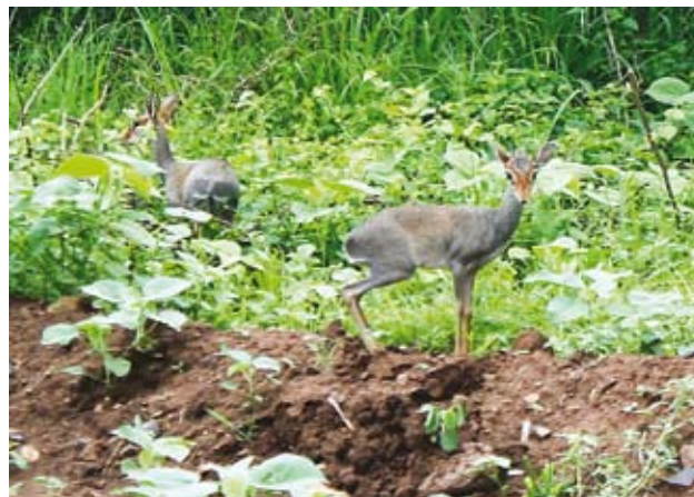
Ryc. 5. Pasące się przy drodze diki.

w górach rzuca się w oczy akacja Farnesa, zwana też mimożą żółtą ( Acacia farnesiana ). Stoki wzniesień zajęte są przez roślinność krzaczastą o różnym stopniu zwartości.