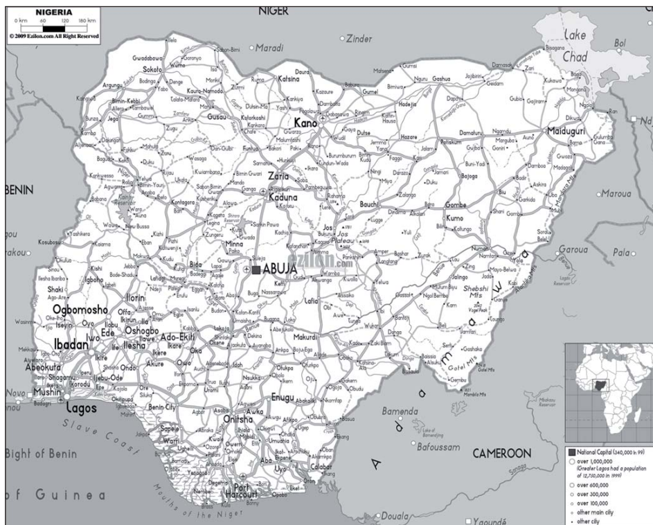
Rysunek 3. Sieć dróg samochodowych w Nigerii

Stan nawierzchni dróg nigeryjskich, zarówno utwardzonych, jak i nieutwardzonych, pozostawał zły. Główną przyczyną był brak właściwej polityki i nieskuteczność działań służb odpowiedzialnych za utrzymanie nawierzchni. Wskutek tego wiele dróg mających nawierzchnię asfaltową ulegało niszczeniu i z czasem stało się znowu drogami żwirowymi. Korzystanie z dróg żwirowych pozostawało z kolei utrudnione ze względu na specyficzne warunki klimatyczne i związaną z nimi porę deszczową. Na istniejących drogach brakowało właściwego oznakowania czy sygnalizacji świetlnej. W rezultacie