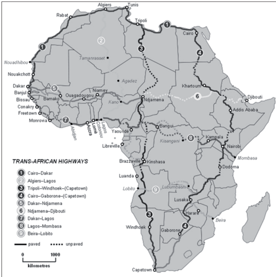
Rysunek 1. Sieć autostrad w Afryce