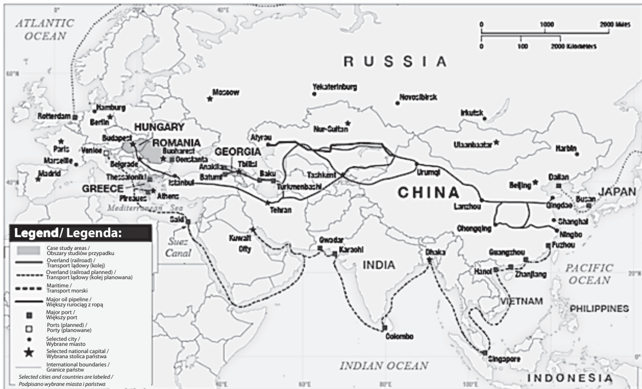
Figure 2. Major Chinese infrastructure projects Rysunek 2. Główne chińskie projekty infrastrukturalne Source: https://carnegieendowment.org/ (accessd 11 February 2022). Źródło: https://carnegieendowment.org/ (dostęp 11.02.2022).