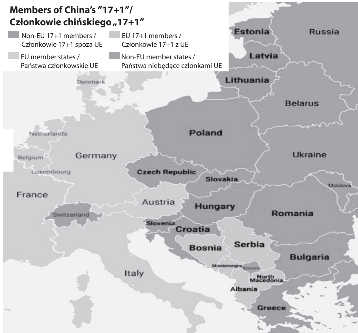
Figure 1. Members of China's "17+1"