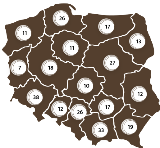
Rysunek 2. Liczba zagród edukacyjnych należących do OSZE i ich rozmieszczenie w ujęciu regionalnym (stan na 16.07.2023)

W chwili badań (lipiec 2023 roku) w OSZE zrzeszonych było 297 zagród edukacyjnych. Ich rozmieszczenie na obszarze kraju było dość zróżnicowane. Województwami, na terenie których funkcjonowało najwięcej gospodarstw tego typu, były dolnośląskie (38) i małopolskie (33). Natomiast najmniej gospodarstw edukacyjnych zlokalizowanych było w województwach lubuskim (7) i łódzkim (10) (rysunek 2).