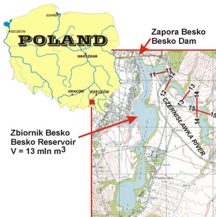
Rysunek 1. Plan sytuacyjny zbiornika „Besko” wraz z badaną odnogą 11–15 numery przekrojów badawczych Figure 1. Plan of the reservoir ”Besko” including the examined branche 11–15 numbers of examined sections

Na rysunku 1 pokazano plan sytuacyjny zbiornika głównego wraz z badaną odnogą, na której zaznaczono rozmieszczenie przekrojów poprzecznych (nr 11 do 15). W roku 1986, tj. 8 lat po oddaniu zbiornika do eksploatacji zostały przeprowadzone pomiary głębokości w przekrojach poprzecznych, zarówno w części głównej zbiornika (10 przekrojów poprzecznych), jak i w części bocznej (przekroje 11–15) [Politechnika Krakowska 1986]. Pomierzono wówczas przyrost miąższości osadów w przekrojach badawczych oraz określono średnie roczne załadowanie zbiornika w okresie 1978–86, wynoszące 0,065 hm 3 ·rok -1 .