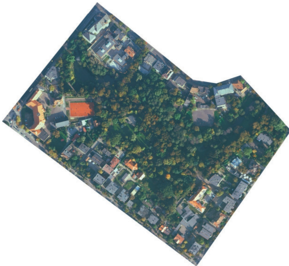
Rysunek 1. Granice zewnętrzne obszaru badawczego Figure 1. External borders of the investigated area

Automatyczna klasyfikacja chmury punktów jest procesem umożliwiającym szybkie pogrupowanie danych. Znajomość parametrów otrzymanej chmury punktów, jak również atrybutów niezbędnych do klasyfikacji czyni proces mało skomplikowanym. W artykule dokonano klasyfikacji w trzech różnych programach: Tiltan Tlid, TerraScan oraz VRMesh.