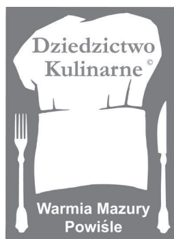
Rys. 3. Logo Europejskiej Sieci Dziedzictwa Kulinarne Warmii, Mazur i Powiśla Fig. 2. European Cuisine Heritage Network logo for region Warmia, Mazury and Powiśle

Dzięki wprowadzeniu etykiety produkty tradycyjne i regionalne przestają być anonimowe. Zwiększa się w ten sposób ich rozpoznawalność, co powinno wpłynąć na wzrost konsumpcji co w konsekwencji doprowadzi do zwiększenia sprzedaży. Natomiast producenci poszerzą swoją świadomość co do istoty znakowania produktów tradycyjnych.