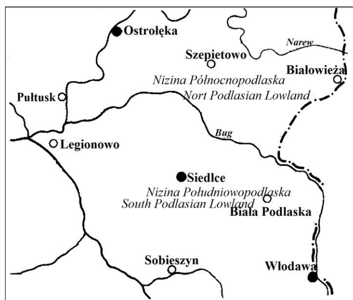
Rys. 1. Stacje w środkowo-wschodniej Polsce Fig. 1. Stations in central-eastern Poland

kowanych przez Główny Urząd Statystyczny (Plony i zbiory głównych ziemiopłodów rolnych z lat 1975-1977, Produkcja głównych ziemiopłodów rolnych i ogrodnicy z lat 1978-1991, Produkcja podstawowych upraw rolnych według województw i grup producentów z lat 1992-1998). Plonowanie pszenicy jarej dla dziewięciu województw (podział administracyjny z lat 1975-1998) po 1998 roku do 2005 roku określono za pomocą predykcji ekonometrycznej, wykorzystując w tym celu analizę szeregów czasowych. Prognozę plonów w kolejnych latach określono jako liczbę przyjętą za najlepszą ocenę wartości zmiennej objaśnianej w okresie prognozowanym. Wyliczono równania trendów plonowania pszenicy jarej w analizowanym trzydziestoleciu, a następnie wykorzystano wartości resztowe tych równań (różnicę między plonem rzeczywistym a wyliczonym z funkcji trendu) w dalszej analizie. W ten sposób uwzględniono zmienność plonowania związaną z postępowaniem hodowlanym i poziomem agrotechniki. Zależność plonowania pszenicy jarej od wartości współczynnika Sieliana zbadano przy pomocy regresji wielokrotnej krokowej postępującej. W równaniach wykorzystano tylko te zmienne, dla których współczynniki regresji były istotne na poziomie \alpha = 0,05 . Dla każdego równania wyznaczono współczynnik determinacji ( R^2 ).