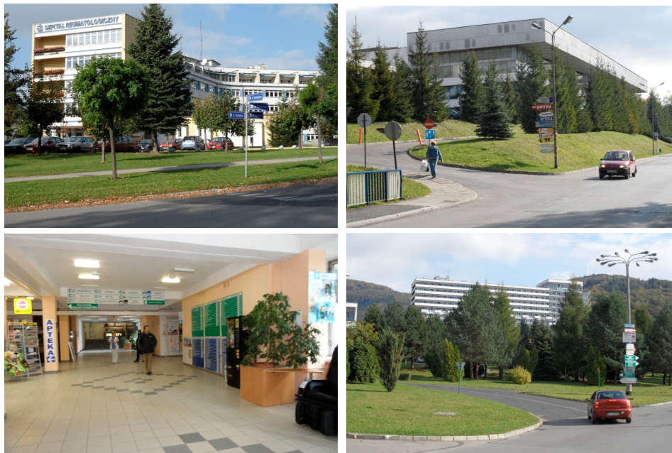
Fotografia 4. Śląski Szpital Reumatologiczno-Rehabilitacyjny, Śląskie Centrum Rehabilitacji, Uzdrawiskowy Zakład Przyrodolecznicy, Sanatorium i Szpital Uzdrawiskowy „Równica” (październik 2012 r.)

Photo 4. The Śląsk Rheumatology-Rehabilitation Hospital, The Śląsk Rehabilitation Centre, The Natural Spa, the “Równica” Spa Sanatorium and Hospital (October 2012)