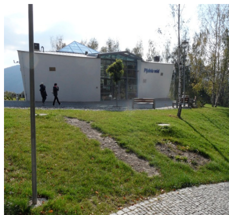
Fotografia 8. Budynek pijalni wód leczniczych oddany do użytku w czerwcu 2012 roku (fot. autorki, październik 2012)

Photo 7. Fountain in close vicinity to the curative water well-room (photo by authoress, October 2012)