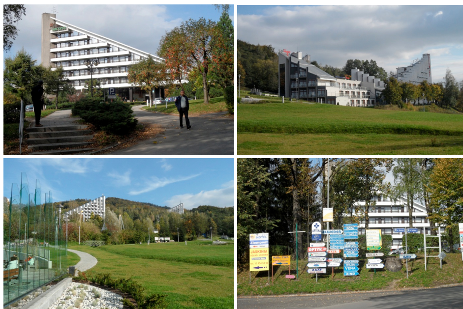
Fotografia 1. Ustronie, budynki sanatoryjne w kształcie piramid