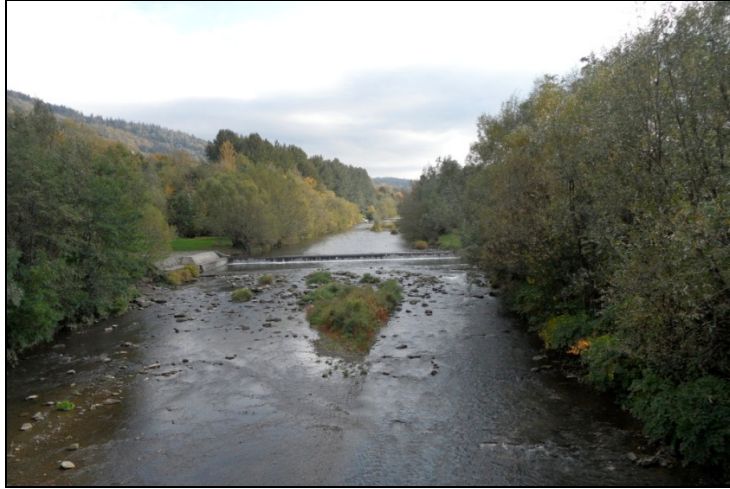
Fotografia 2. Wisła, w dolinie której zbudowano miasteczko Ustroń – widok na rzekę z mostu przy ul. M. Grażyńskiego - Szpitalnej (fot. autorki, październik 2012 r.)