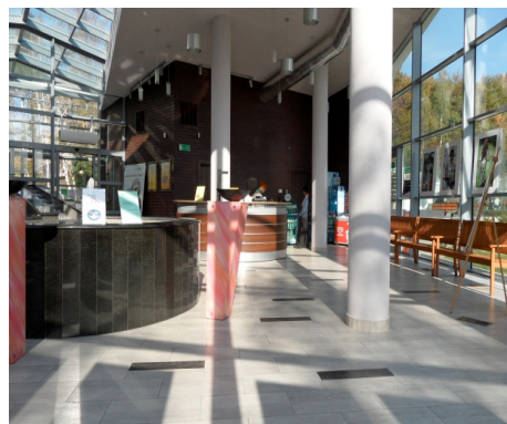
Fotografia 6. Wnętrze Pijalni wód (fot. autorki, październik 2012)

Photo 5. An information board describing the “Amelia” spring on a wall in the well-room (photo by authoress, October 2012)