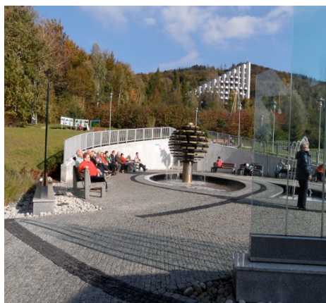
Fotografia 7. Fontanna w bezpośrednim sąsiedztwie Pijalni wód leczniczych (fot. autorki, październik 2012)

Photo 6. The interior of the well-room (photo by authoress, October 2012)