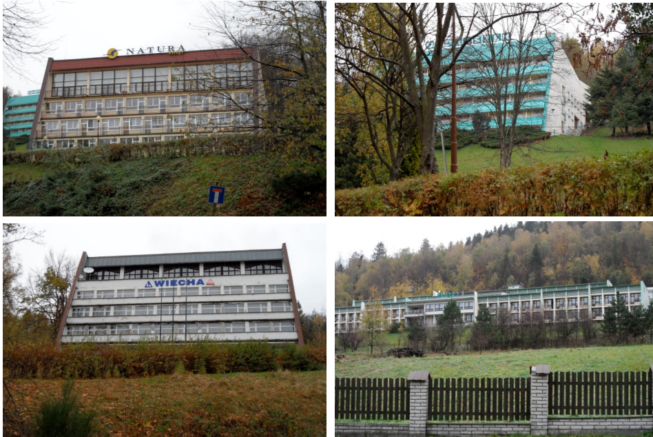
Fotografia 3. Wielokondygnacyjne budynki wczasowe z lat 60. XX wieku: Natura, Ondraszek, Wiecha, Jawor, usytuowane w dolinie Jaszowca (listopad 2012 r.) Photo 3. Multi-storey holiday buildings from the 1960s: Natura, Ondraszek, Wiecha, Jawor, located in the Jaszowiec valley (November 2012)

W 1967 roku Ustroń ponownie uzyskał status uzdrowiska, a w 1973 roku włączono do miasta wsie Lipowiec i Nierodzin.