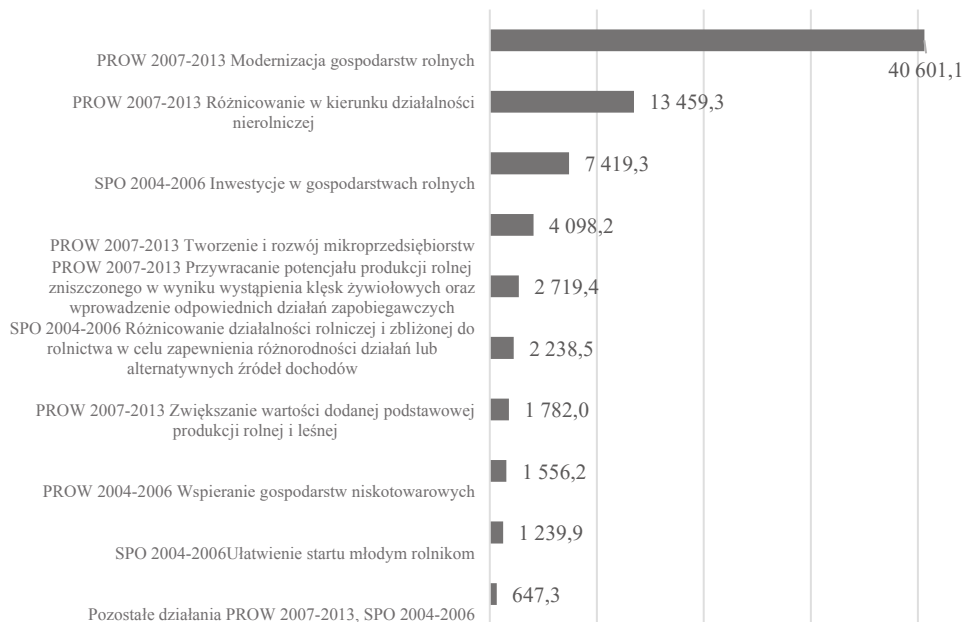
Rys. 1. Wartość projektów inwestycyjnych zrealizowanych w latach 2004-2015 przez badane gospodarstwa rolne (w tys. zł) według działań realizowanych w ramach WPR

Łączna wartość tych nakładów wyniosła nieco ponad 54 mln zł, co stanowiło ponad 71% wartości wszystkich badanych projektów.