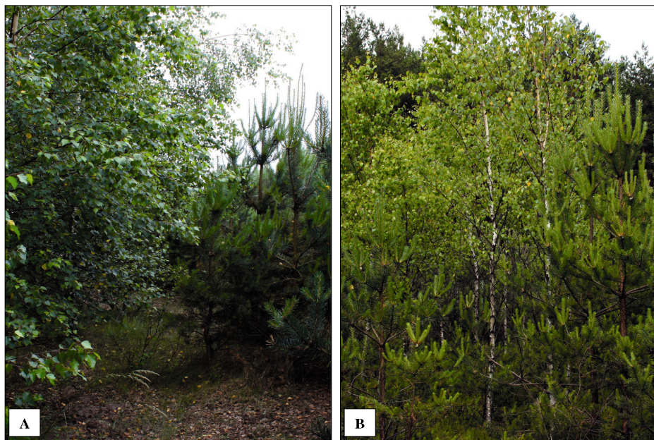
Fotografia 2. Granica między młodnikami sosnowymi a brzozowymi na terenach porolnym (A) i leśnym (B) Foto 2. Border of forest plantation of Scots pine (P-So) and birch (P-Brz) on post-arable land (A) and forest land (B)