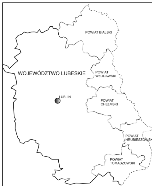
Ryc. 1. Powiaty przygraniczne na tle województwa lubelskiego. Fig. 1. Border districts on the background of the Lublin province