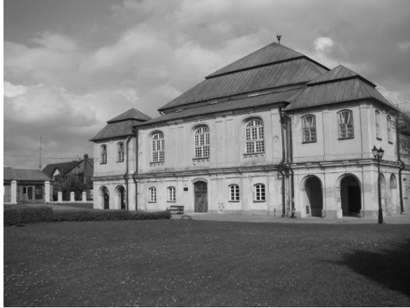
Ryc. 3. Synagoga Wielka we Włodawie (autor J. Szczęsna) Fig. 3. Great Synagogue in Włodawa (author J. Szczęsna)

jego obiekty są dostępne dla turystów, istnieje możliwość zwiedzania z przewodnikiem oraz skorzystania z niewielkiej bazy noclegowo-gastronomicznej.