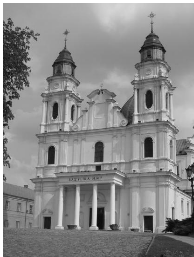
Ryc. 2. Bazylika Narodzenia Najświętszej Marii Panny w Chełmie (autor J. Szczęсна)

Do pozostałych obiektów zabytkowych znajdujących się na pograniczu należą zabudowania gospodarcze np.: młyny wodne, wiatraki, spichlerze, stajnie, gorzelnie, wieżyczki wodne; budynki użyteczności publicznej takie jak szkoły, szpitale, urzędy, domy zajezdne oraz spora ilość obiektów o charakterze militarnym, przede wszystkim fortyfikacje Twierdzy Brzeskiej, znajdujące się w powiecie bialskim. Oprócz tego status zabytków posiadają pojedyncze domy mieszkalne zarówno miejskie jak i wiejskie, miejsca martyrologii oraz całe układy osadnicze i komunikacyjne.