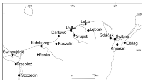
Rys. 1. Rozmieszczenie stacji meteorologicznych IMGW w strefie polskiego wybrzeża Bałtyku Fig. 1. Location of IMWM stations along the Polish Baltic coast

*krótszy okres pomiarów (1954-1965 i 1968-1976).