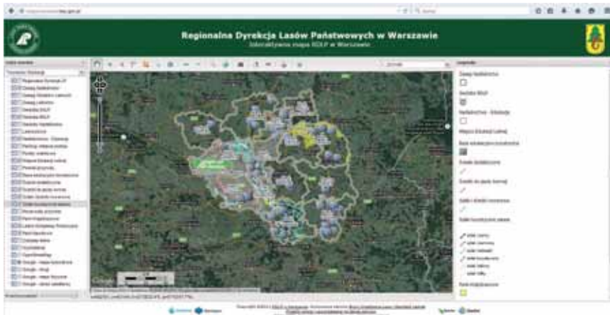
Ryc. 3. Interaktywna mapa RDLP w Warszawie zawierająca m.in. informacje z zakresu turystycznego udostępnienia lasu

Działania warszawskich leśników zmierzają do szerokiego udostępnienia lasu społeczeństwu, przy jednoczesnym kanalizowaniu ruchu turystycznego i rekreacyjnego, ograniczając w ten sposób wpływ presji wypoczywających na przyrodę. Narzędziem prezentującym lasy RDLP w Warszawie jest interaktywna mapa (ryc. 3), w której użytkownik może wybierać warstwy informacyjne związane z zakresem poszukiwanej treści (np. parkingi, szlaki turystyczne, pomniki przyrody itp.). Dzięki niej każdy użytkownik Internetu, może uzyskać informacje o obiektach udostępnienia lasów na terenie RDLP w Warszawie. Jest to ważne nie tylko z punktu widzenia samych możliwości przemieszczania się i pobytu w wyznaczonych miejscach zagospodarowania turystycznego, ale również ze względu na to, że wpisuje