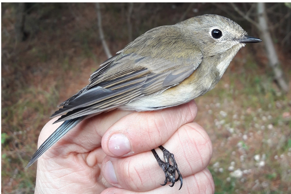
Fot. 25. Modraczek Tarsiger cyanurus , Dąbkowice, październik 2019 – Red-flanked Bluetail, Dąbkowice, October 2019