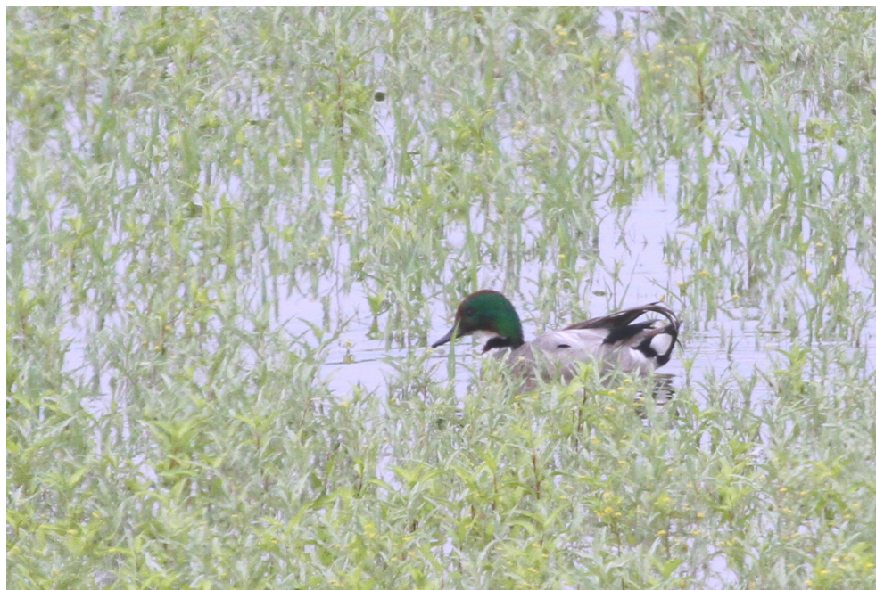
Fot. 28. Czuprynka Mareca falcata , Spytkowice, czerwiec 2019 – Falcated Duck , Spytkowice, June 2019