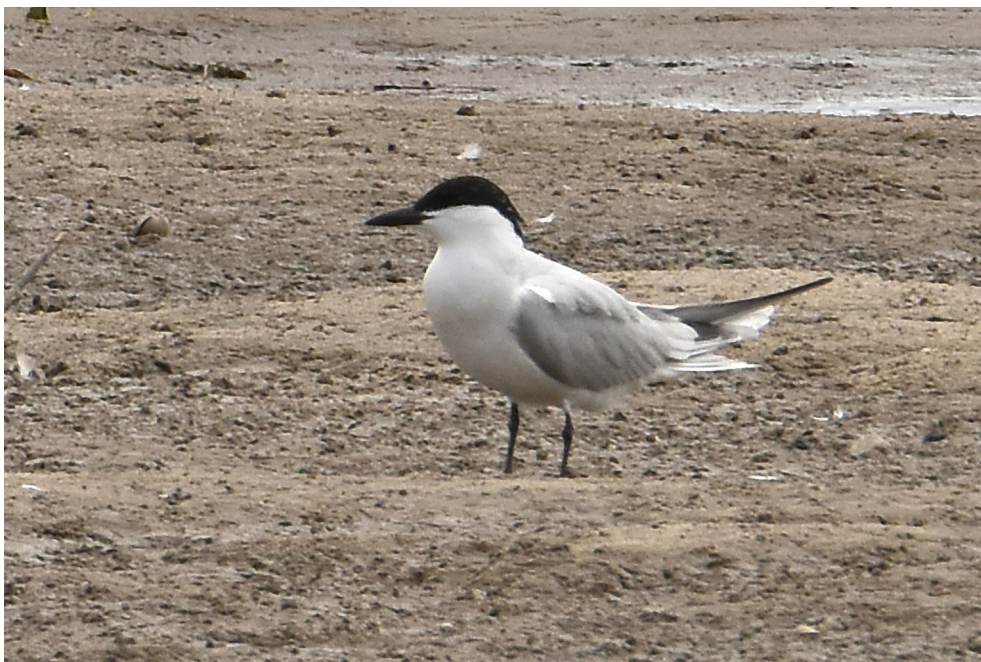
Fot. 12. Rybitwa krótkodzioba Gelichelidon nilotica , Czatkowy, lipiec 2019 – Gull-billed Tern , Czatkowy, July 2019