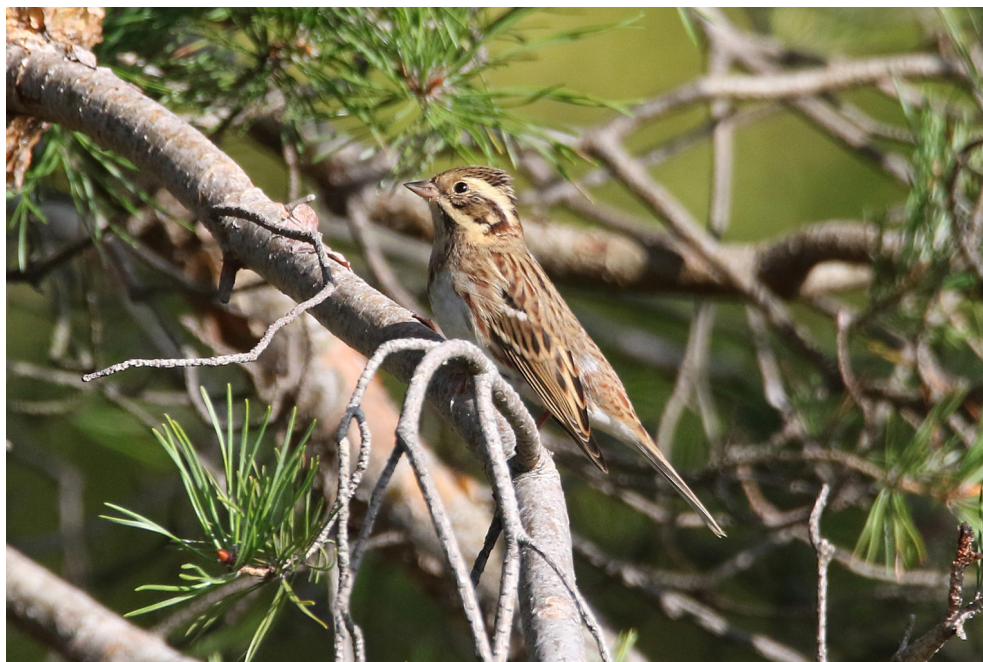
Fot. 26. Trznadel czubaty Emberiza rustica , Jastarnia, wrzesień 2019 (fot. Z. Kajzer) – Rustic Bunting, Jastarnia, September 2019