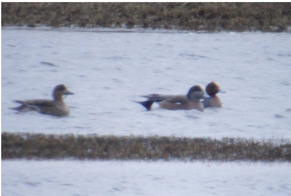
Fot. 3. Świstun amerykański Mareca americana , Strękowa Góra, luty 2019 – American Wigeon , Strękowa Góra , February 2019