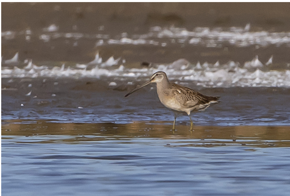
Fot. 6. Szlamiec długodzioby Limnodromus scolopaceus , Radziądz, wrzesień 2019 – Long-billed Dowitcher , Radziądz , October 2019