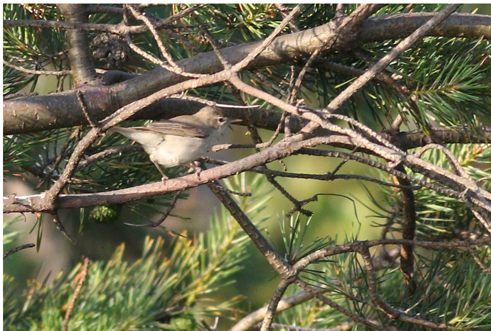
Fot. 21. Zaganiacz blady Iduna pallida , Hel, czerwiec 2019 – Eastern Olivaceous Warbler, Hel, June 2019