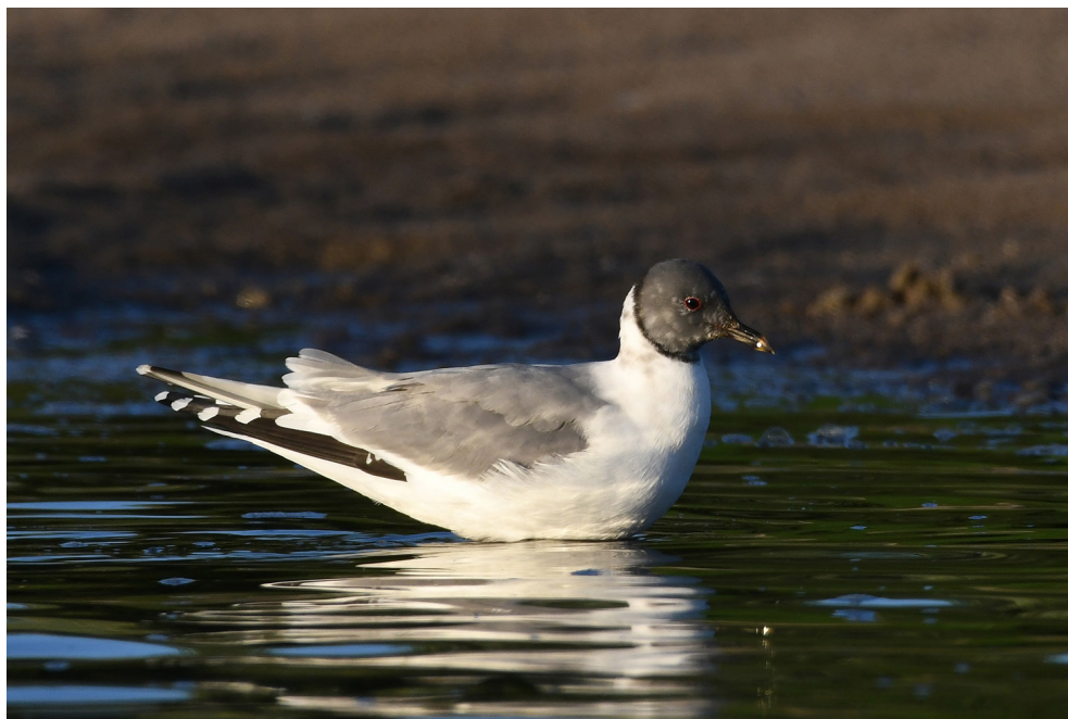
Fot. 9. Mewa obroźna Xema sabini , Piekło, lipiec 2019 (fot. A. Janczyszyn) – Sabine's Gull, Piekło, July 2019