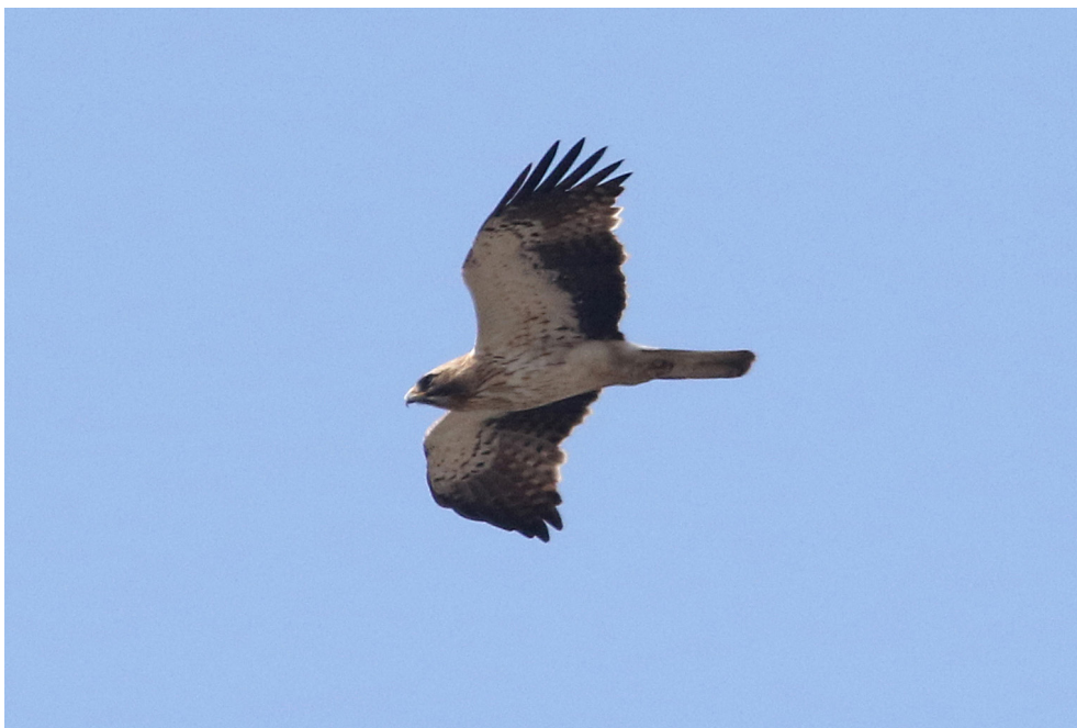
Fot. 17. Orzełek Hieraaetus pennatus , Kuźnica, maj 2019 – Booted Eagle, Kuźnica, May 2019