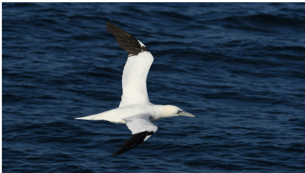
Fot. 14. Głuptak Morus bassanus , Bałtyk na N od Międzyzdrojów, styczeń 2019 – Northern Gannet, Międzyzdroje offshore, January 2019