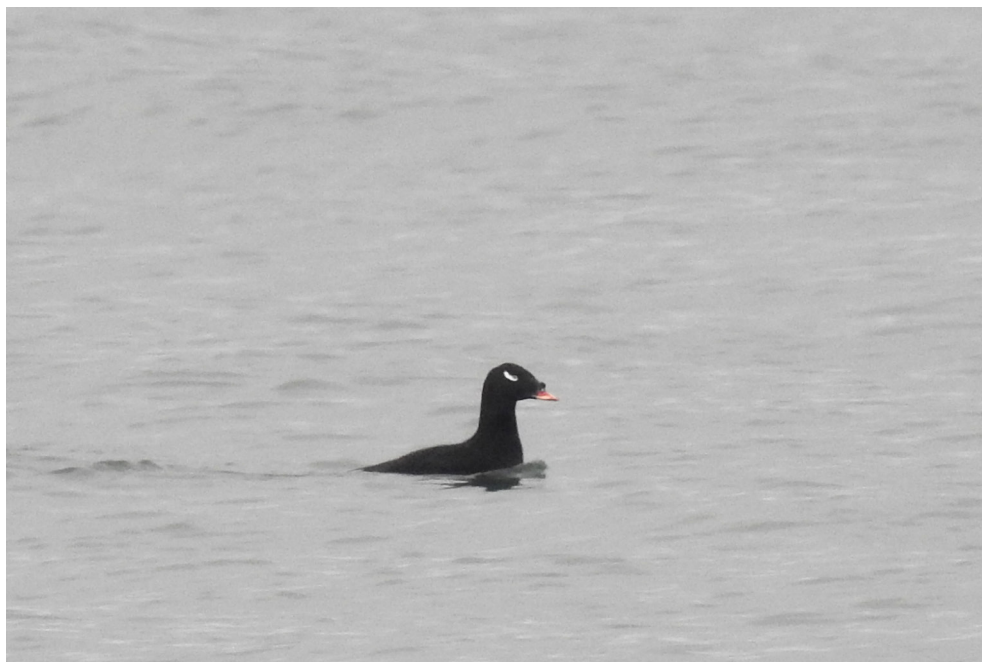
Fot. 1. Uhla azjatycka Melanitta stejnegeri , Gdańsk Stogi, grudzień 2019 – Stejneger's Scoter , Gdańsk Stogi , December 2019