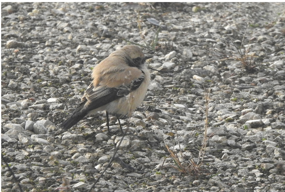
Fot. 24. Białorzzytka pustynna Oenanthe deserti , Biała Podlaska, grudzień 2019 – Desert Wheatear, Biała Podlaska, December 2019