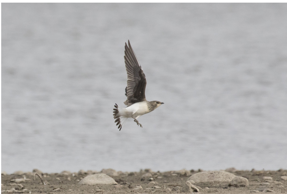
Fot. 8. Żwirowiec stepowy Glareola nordmanni , zb. Jeziorsko, wrzesień 2019 – Black-winged Pratincole , Jeziorsko Reservoir, September 2019