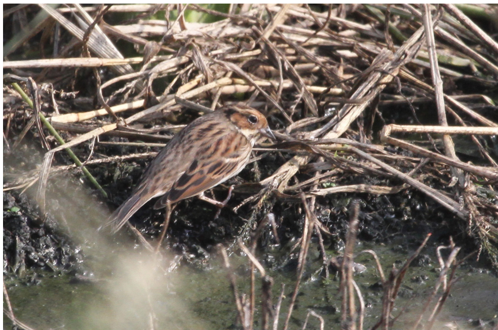
Fot. 27. Trznadelek Emberiza pusilla , Hel, wrzesień 2019 – Little Bunting, Hel, September 2019