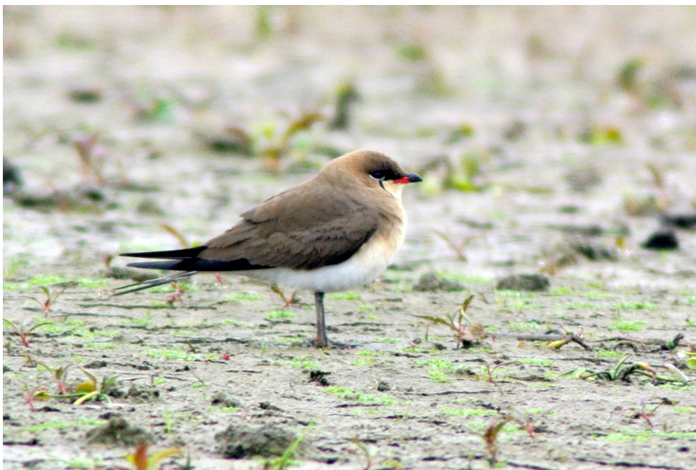
Fot. 7. Żwirowiec łąkowy Glareola pratincola , Spytkowice, maj 2019 – Collared Pratincole , Spytkowice, May 2019