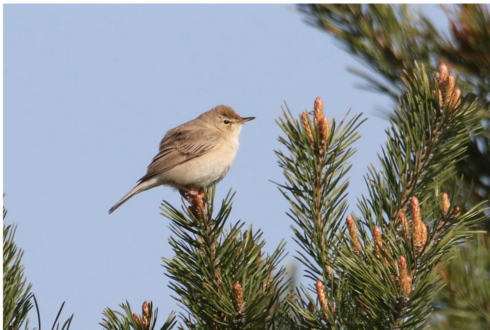
Fot. 20. Zaganiacz mały Iduna caligata , Hel, maj 2019 – Booted Warbler, Hel, May 2019