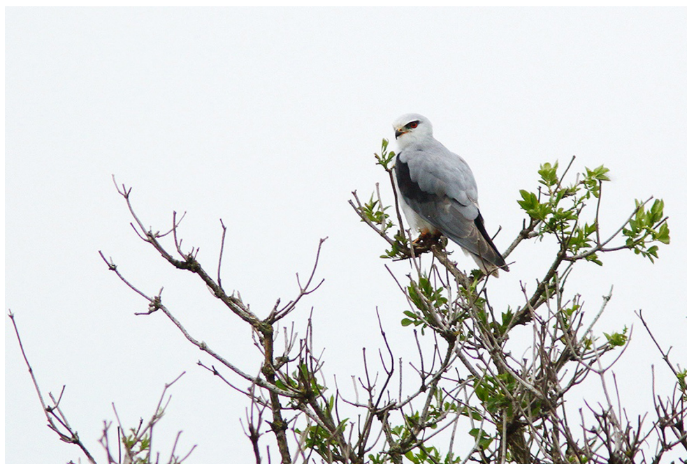
Fot. 15. Kaniuk Elanus caeruleus , Kondratowice, kwiecień 2019 – Black-winged Kite, Kondratowice, April 2019