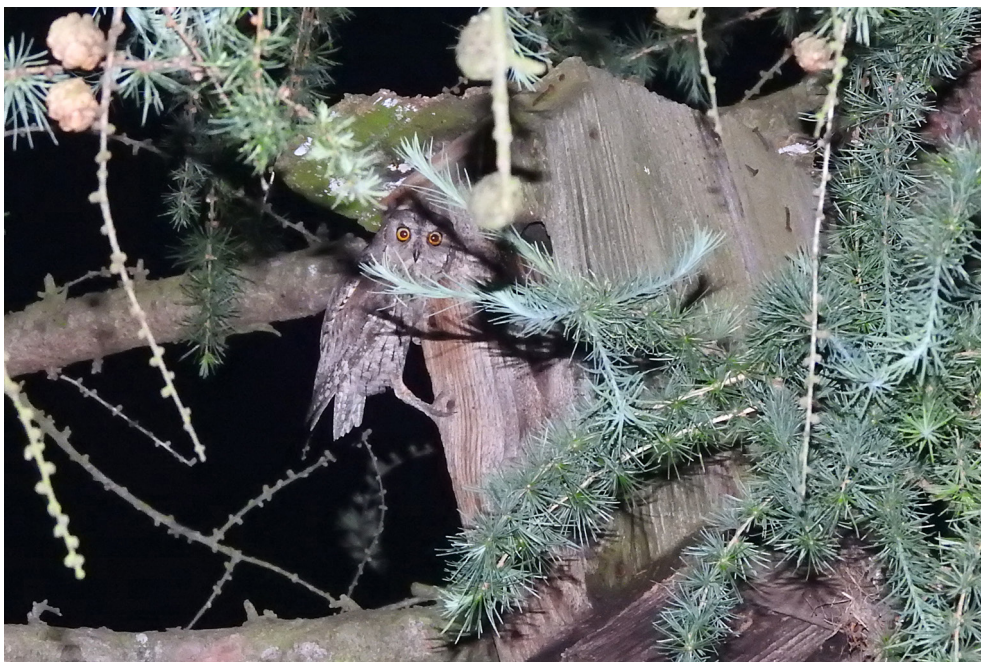
Fot. 18. Syczek Otus scops , Tarnowiec, maj-czerwiec 2019 – Eurasian Scops Owl , Tarnowiec, May-June 2019