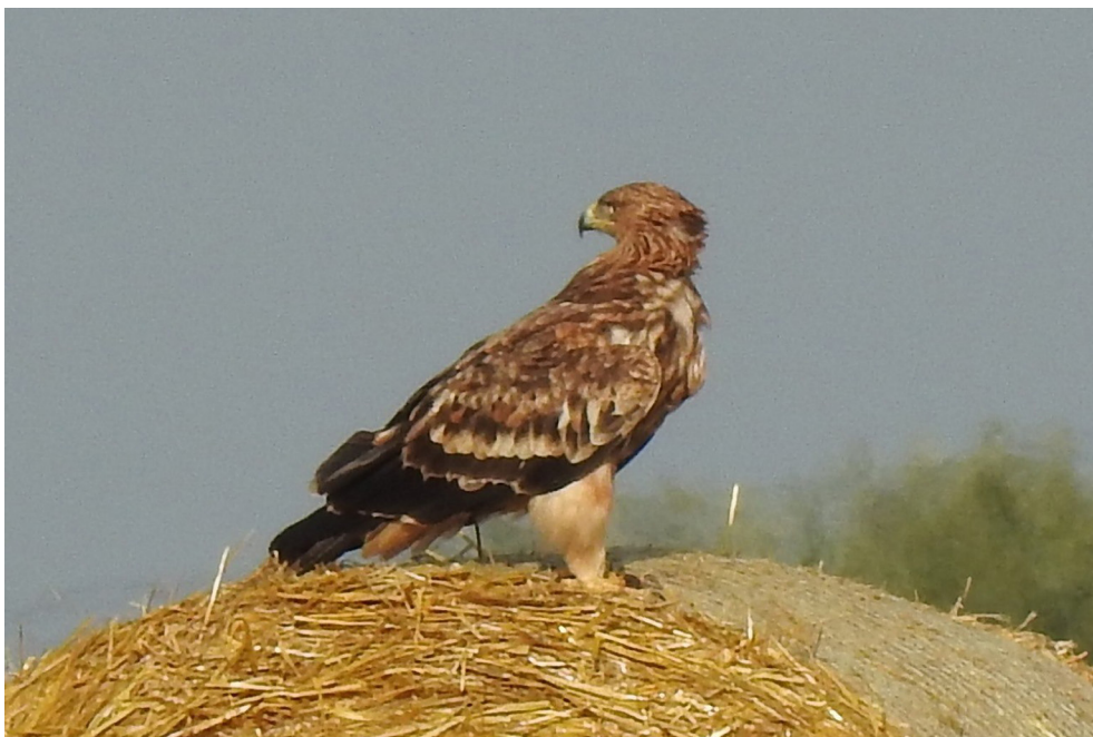
Fot. 16. Orzeł cesarski Aquila heliaca , Białobrzegi, sierpień 2019 – Eastern Imperial Eagle, Białobrzegi, August 2019