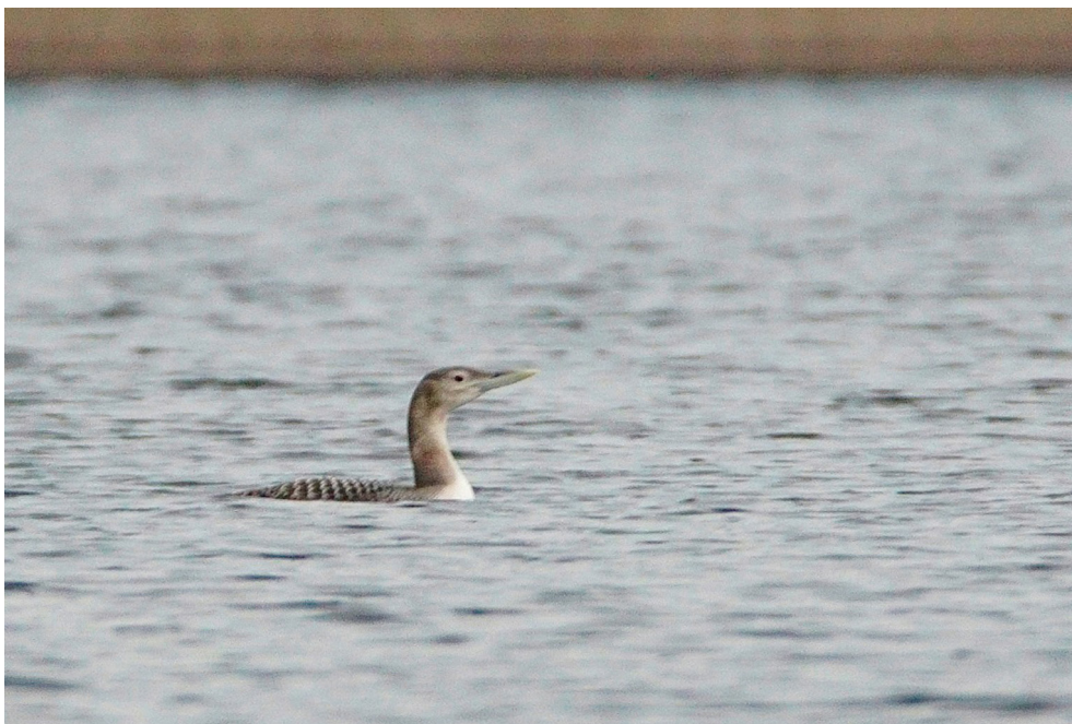
Fot. 13. Nur białodzioby Gavia adamsii , jez. Wigry, grudzień 2019 – White-billed Diver , Wigry Lake, December 2019