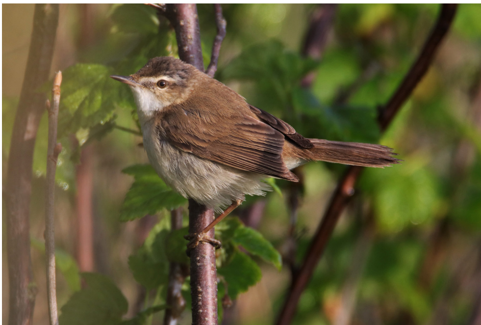
Fot. 22. Trzcinniczek kaspijski Acrocephalus agricola , Nadrzecze, maj 2019 – Paddy-field Warbler, Nadrzecze, May 2019