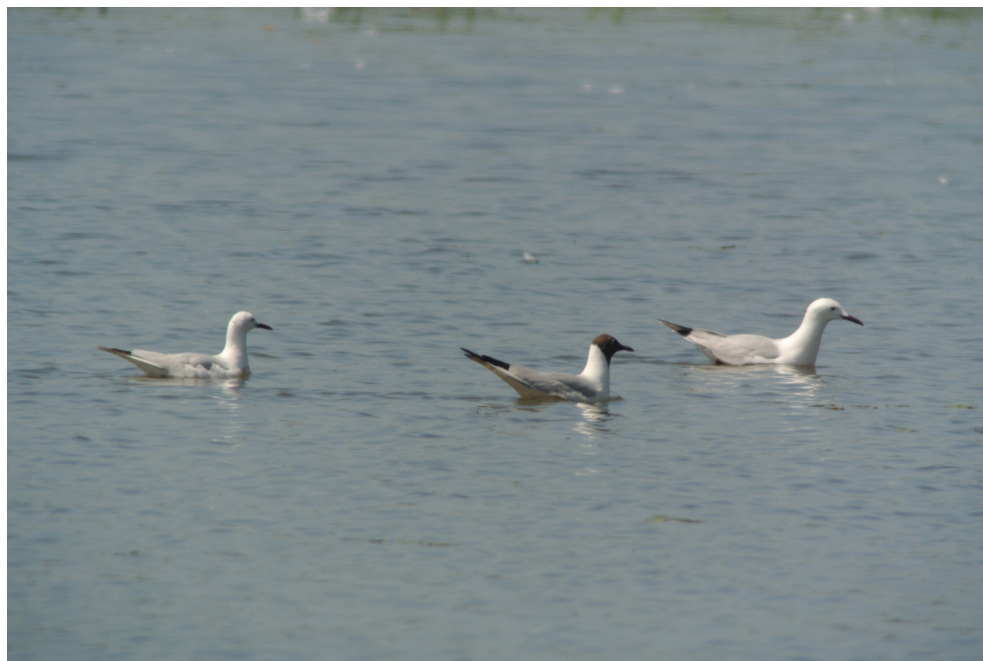
Fot. 10. Mewa cienkodzioba Chroicocephalus genei , Bugaj, czerwiec 2019 – Slender-billed Gull, Bugaj, June 2019