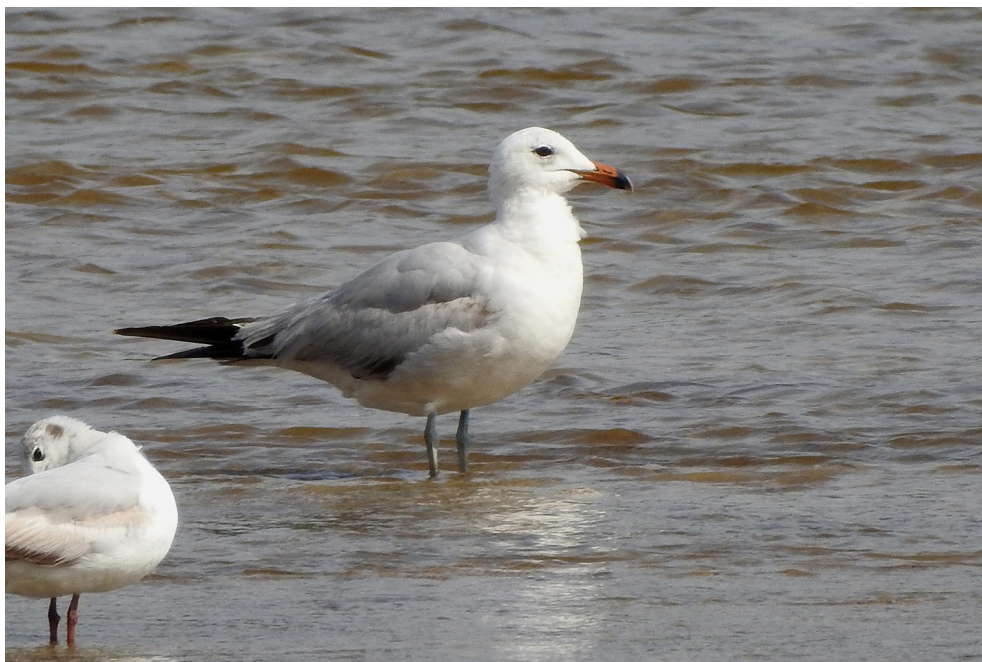
Fot. 11. Mewa śródziemnomorska Ichthyaetus audouinii , Toruń, czerwiec 2019 – Audouin's Gull, Toruń, June 2019