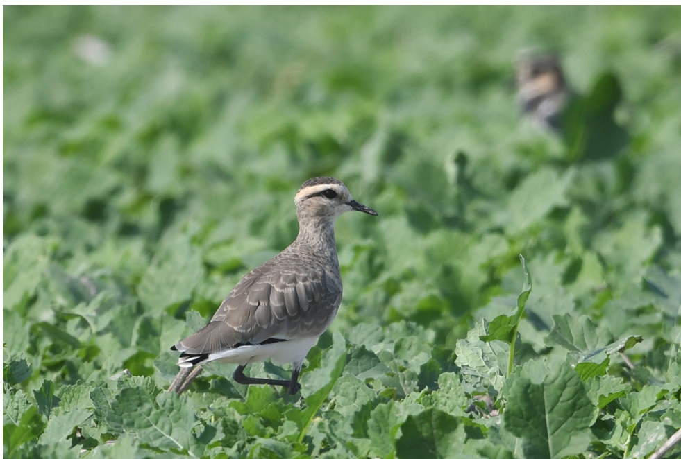
Fot. 5. Czajka towarzyska Vanellus gregarius , Otoki, sierpień 2019 – Sociable Plover , Otoki , August 2019