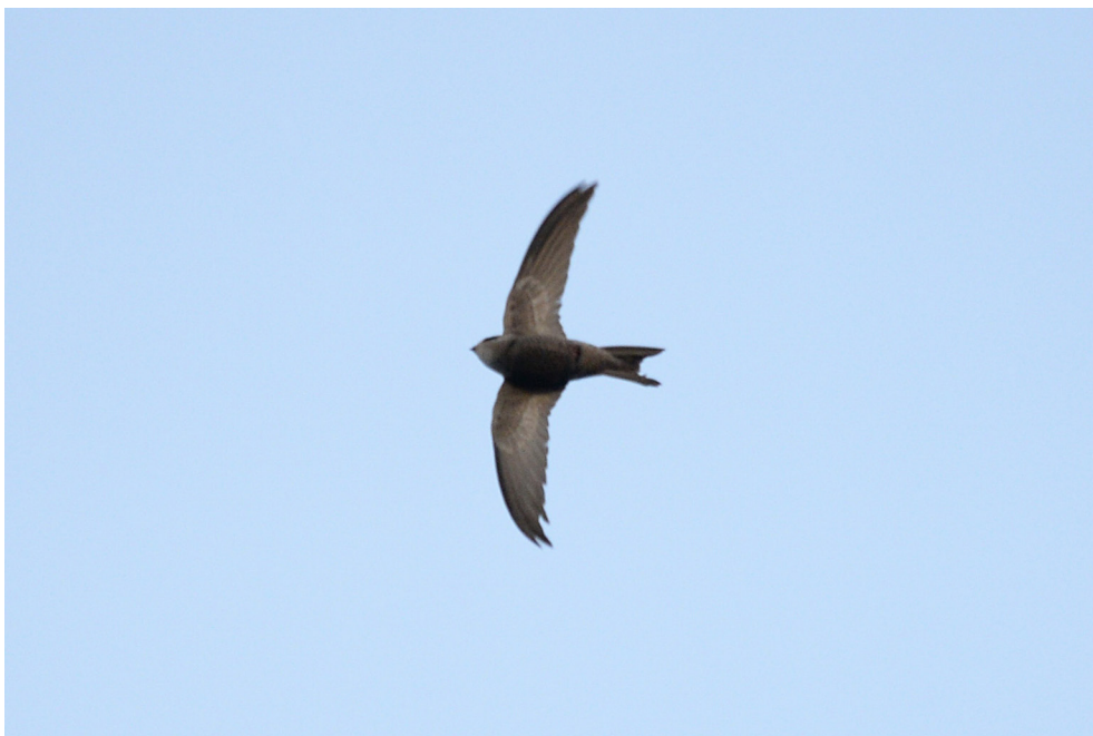
Fot. 4. Jerzyk blady Apus pallidus , Krynica Morska, październik 2019 – Pallid Swift , Krynica Morska , October 2019