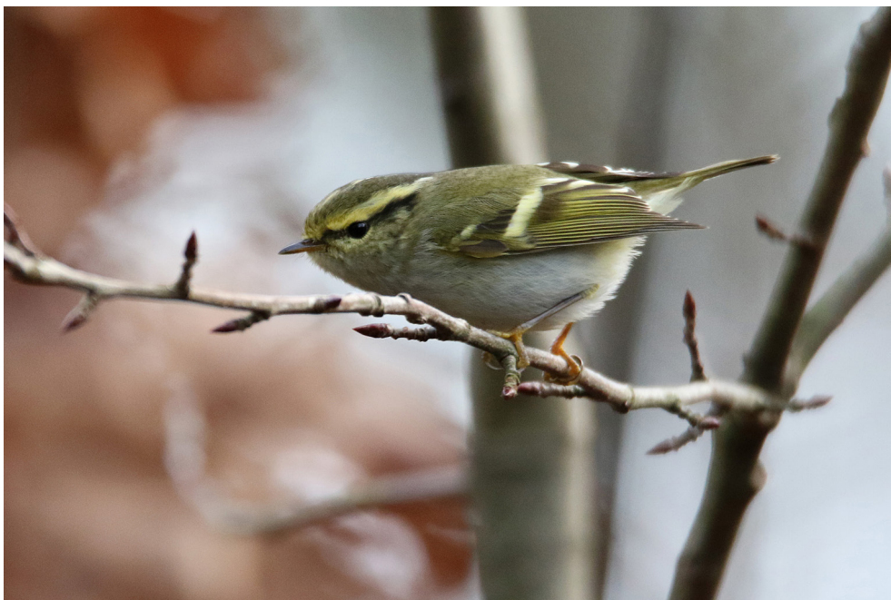
Fot. 23. Świstunka złotawa Phylloscopus proregulus , Żurawie, grudzień 2019 – Pallas's Leaf Warbler, Żurawie, December 2019