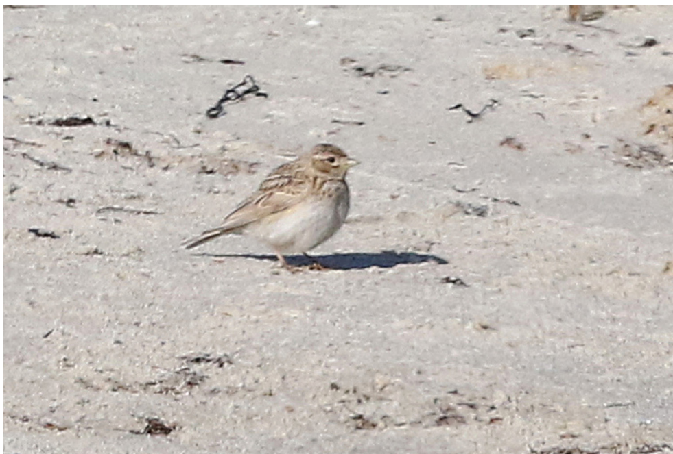
Fot. 19. Skowrończyk mały Alaudala rufescens , Hel, maj 2019 – Lesser Short-toed Lark , Hel, May 2019