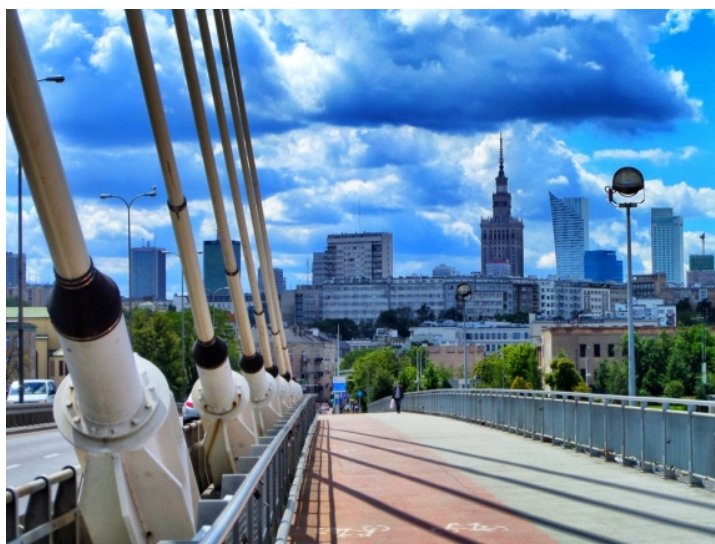
Fot. 3. Pałac Kultury i Nauki widoczny od korpusu głównego po iglicę z Mostu Świętokrzyskiego Photo 3. The view of Palace of Culture and Science from main trunk to spire from Świętokrzyski Bridge

Fieldorfa „Nila”, al. Waszyngtona z ul. Lipską (Praga-Południe), z Plaży „ZOO”, ze skrzyżowania ul. Wybrzeże Kościuszkowskie z ul. Okrzei, w okolicach Portu Praskiego, ze stacji PKP Warszawa Wschodnia (Praga-Północ), na skrzyżowaniach ul. Sobieskiego z ulicami Idzikowskiego, Mangalii, Sikorskiego, ul. Powsińskiej z ul. św. Bonicafego (Mokotów), na skrzyżowaniach ul. Kasprzaka z licznymi ulicami na Woli (m.in. z Karolkową, Skierniewicką, Płocką, Bema, Ordoną, al. Prymasa Tysiąclecia), na skrzyżowaniach ul. Czecha z ulicami Wierchowskiego i Wawerską oraz na początku Traktu Brzeskiego (Wawer), a także w okolicach Kanału Żerańskiego (Białoleka). Korpus główny Pałacu ujrzyć można także z kilku mostów: Siekierkowskiego, Gdańskiego, Świętokrzyskiego (fot. 3), Poniatowskiego, Śląsko-Dąbrowskiego oraz Grota-Roweckiego, a także kładek nad ul. Sobieskiego na Mokotowie (np. tej w okolicach ul. Czarnomorskiej) czy nad ul. Ostrobramską przy ul. Grenadierów (Praga-Południe). Nietuzinkowy punkt widokowy na całe centrum Warszawy wraz z Pałacem (od korpusu głównego wzwyż) znajduje się przy ul. Kalorycznej na Mokotowie przy ogródkach działkowych, gdzie ten imponujący widok stanowi tło dla łąki na Siekierkach.