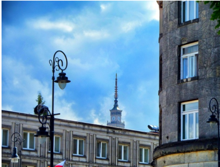
Fot. 6. Pałac Kultury i Nauki widoczny od wieży zegarowej po iglicę ze skrzyżowania ul. Krakowskie Przedmieście z ul. Królewską

Photo 6. The view of Palace of Culture and Science from clock tower to spire from junction of Krakowskie Przedmieście Street and Królewska Street