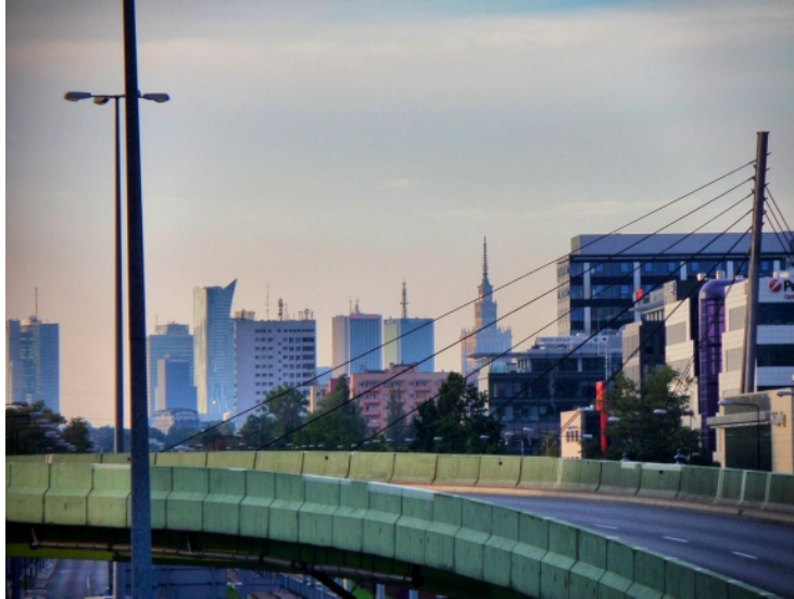
Fot. 4. Pałac Kultury i Nauki widoczny od tarasu widokowego po iglicę z kładki nad ul. Rzymowskiego (okolice ul. Cybernetyki)

mnianych wcześniej arterii komunikacyjnych (m.in. al. Jana Pawła II, ul. Powsińskiej, Al. Jerozolimskich) z mniejszymi ulicami. Ta część Pałacu widoczna jest także z jednej z granic administracyjnych Warszawy – w okolicach skrzyżowaniu ul. Górczewskiej z ul. Lazurową (Bemowo).