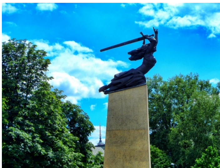
Fot. 7. Iglica Pałacu Kultury i Nauki widoczna z okolic Pomnika Bohaterów Warszawy (przy ul. Kapucyńskiej) Photo 7. The view of Palace of Culture and Science's spire near the Monument of Warsaw Heroes (from Kapucyńska Street)