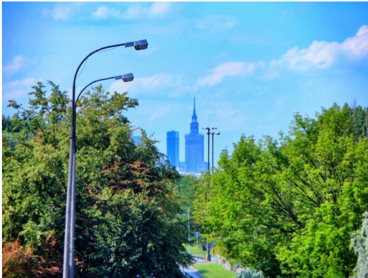
Fot. 2. Pałac Kultury i Nauki widoczny od baszt bocznych po iglicę z kładki nad ul. Sobieskiego (w okolicach ul. Iberyjskiej)

Wskazane powyżej miejsce jest jednym z niewielu punktów widokowych na Pałac od baszt bocznych po iglicę znajdujących się poza Śródmieściem. Pozostałe trzy zidentyfikowane przez autora znajdują się na stacji PKP Warszawa Zachodnia na Ochocie (choć należy zwrócić uwagę, iż zapewne ze względu na podwyższenie peronów), a także na kładkach nad ul. Sobieskiego (w okolicach skrzyżowania z ul. Iberyjską – fot. 2) oraz nad ul. Powiśńską (przy skrzyżowaniu z ul. Okrężną). W Śródmieściu natomiast tego typu widok autor zauważył przy Placu Grzybowski, a także na skrzyżowaniach ul. Marszałkowskiej z ulicami Królewską oraz Nowogrodzką (czyli ich krańcach znajdujących się w pobliżu kwartału centralnego).