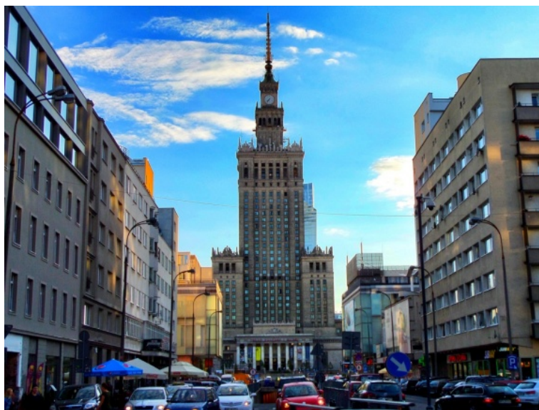
Fot. 1. Pałac Kultury i Nauki widoczny od podstawy po iglicę z ul. Złotej (po stronie wschodniej) Photo 1. The view of Palace of Culture and Science from foundation to spire on Złota Street (east side)

chmur zasłaniane są przez różnego rodzaju względnie małe obiekty, np. drzewa). Ponadto punkty, a nawet ciągi widokowe na cały PKiN (choć z przysłoniętymi bocznymi częściami podstawy) znajdują się w kanionach ul. Wallenberga, ul. Złotej (z obydwu stron budynku) oraz ul. Pankiewicza. Ich krańce od strony tego budynku to bez wątpienia jedne z najbardziej spektakularnych otwarć widokowych na PKiN. Walory tych ulicznych ciągów widokowych zostały na tyle docenione, że znajdujące się tam otwarcia widokowe objęto ochroną prawną poprzez zapisy planu miejscowego z 2010 roku 5 (zaktualizowanego w 2014 r. 6 ). Otwarcia co prawda zostały objęte ochroną, jednak całe osie widokowe niestety nie. Widoki na Pałac w całej okazałości znajdowały się nie tylko na krańcach ul. Złotej od strony budynku (fot. 1), ale także w dalszej części tej ulicy aż do skrzyżowania z ul. Żelazną (tam widać Pałac od podstawy po iglicę, lecz nieco przysłonięty przez wieżowiec Żłota 44) oraz w ciągu ulicznym Złota-Przeskok-Górskiego. Tam widok na Pałac został w dość dużym stopniu zaburzony przez budowę w 2015 roku biurowca Astoria na rogu ul. Przeskok i ul. Szpitalnej. O bezpowrotnej utracie w kompozycji urbanistycznej Warszawy tej wyjątkowej osi widokowej zakończonej okazałą bryłą Pałacu Kultury i Nauki pisał m.in. reportażysta Filip Springer (2015) 7 .