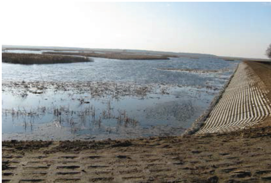
Fotografia 13. Odbudowa I-go etapu zbiornika wodnego Mosty o objętości 6,8 mln m 3 przekazanego do użytkowania w 2011 r.