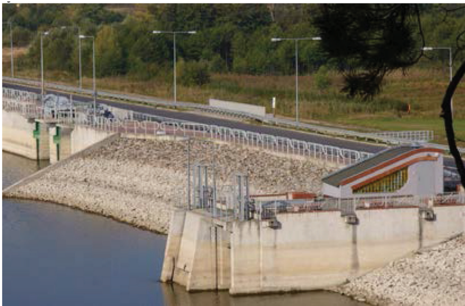
Fotografia 9. Elektrownia wodna o mocy 362 kW w zaporze głównej zbiornika Nielisz, przekazana do użytkowania w 2008 r.