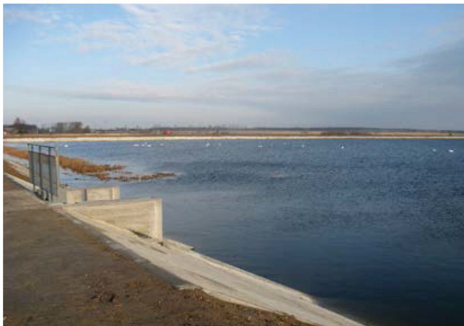
Fotografia 6. Odbudowany zbiornik wodny Mosty o objętości 6,8 mln m 3 w systemie KWK w ramach I-go etapu.