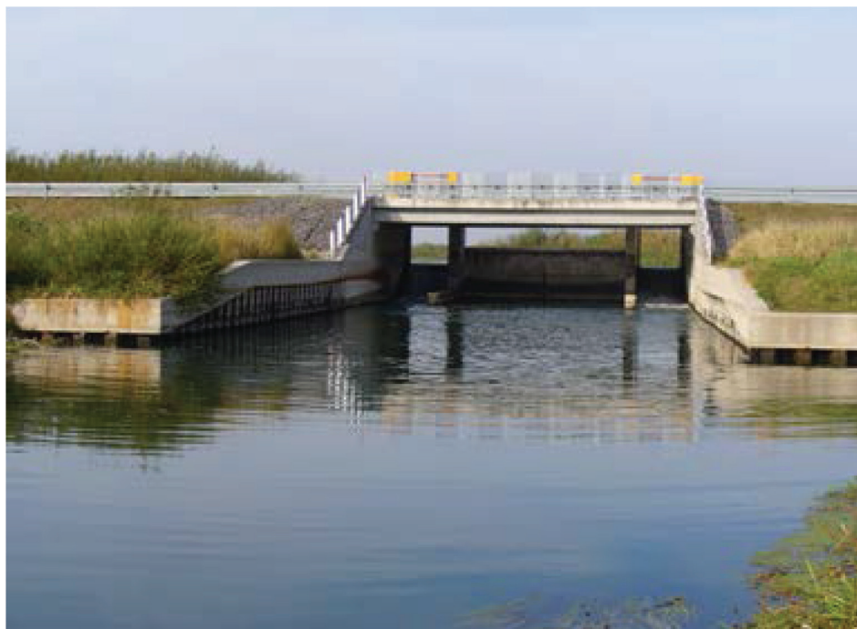
Fotografia 8. Jaz zapory zbiornika wstępnego Nielisz na rzece Por o objętości 1,57 mln m 3 .