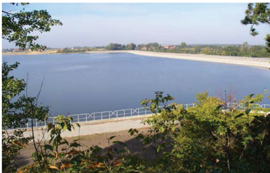
Fotografia 2. Zapora główna na rzece Wieprz na długości 845 m i wys. 21,33 stopy zbiornika Nielisz o objętości 19,48 mln m 3 .