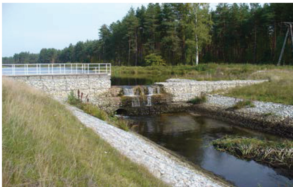
Fotografia 4. Jaz w zaporze głównej o świetle 5 m, wys. piętrzenia 3,9 m zbiornika wodnego Aleksandrów o obj. 140,5 tys. m 3 .