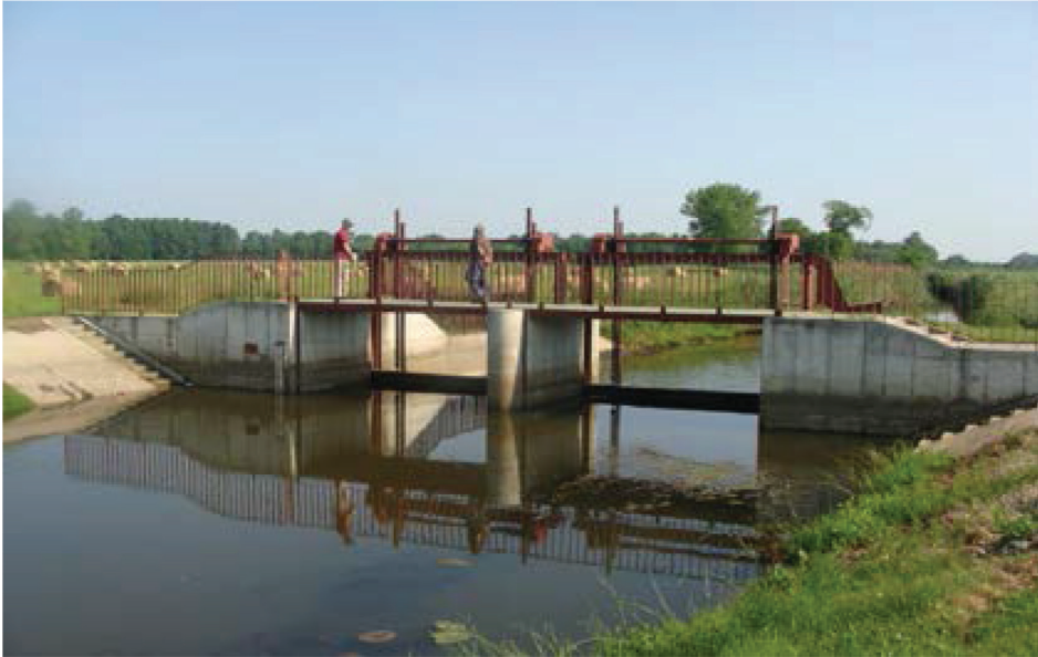
Fotografia 5. Jaz Ortel Królewski o świetle 2 x 4,0 m i wysokości piętrzenia 2,0 m na rzece Zielawie w systemie Kanału Wieprz – Krzna.