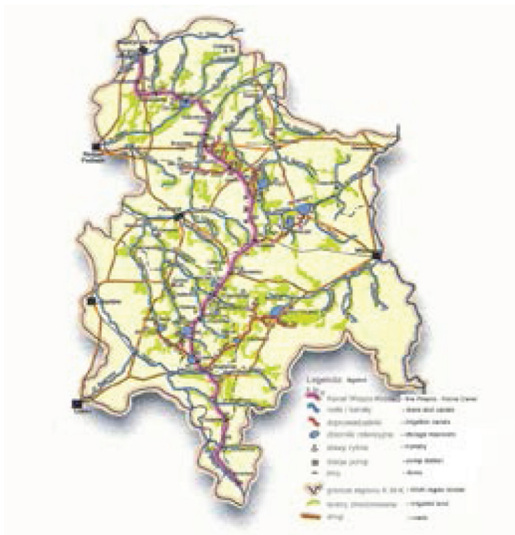
Rysunek 3. System wodny Kanału Wieprz – Krzna wykonany w latach 1954 – 1975.