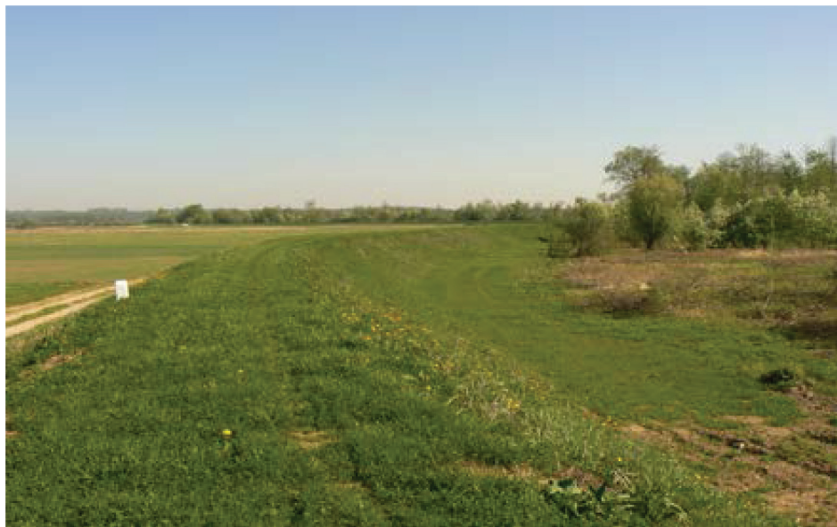
Fotografia 3. Wał przeciwpowodziowy rzeki Wisły na długości 7,1 km w dolinie Janiszowskiej.