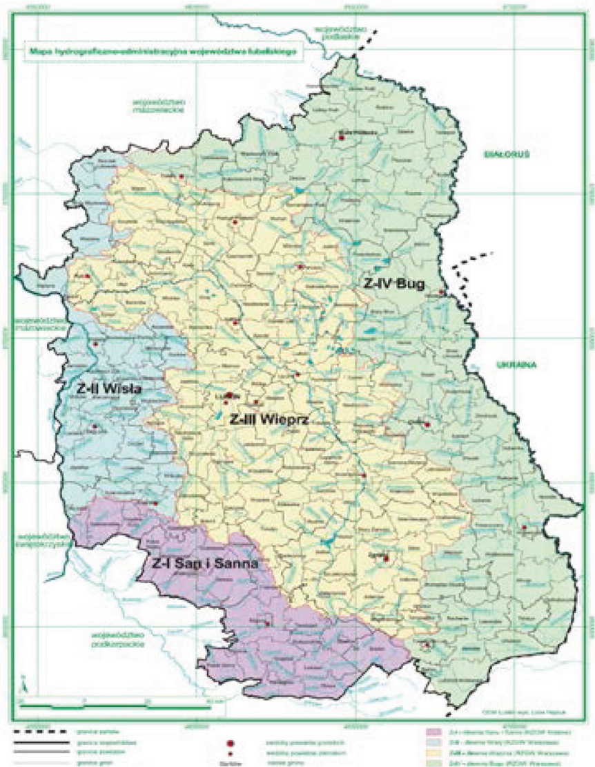
Rysunek 1. Mapa hydrograficzno – administracyjna województwa lubelskiego

Z-III Wieprz i Z-IV Bug). Usytuowanie wydzielonych zlewni na tle podziału administracyjnego Lubelszczyzny ilustruje mapa hydrograficzno – administracyjna województwa lubelskiego (rys. 1).