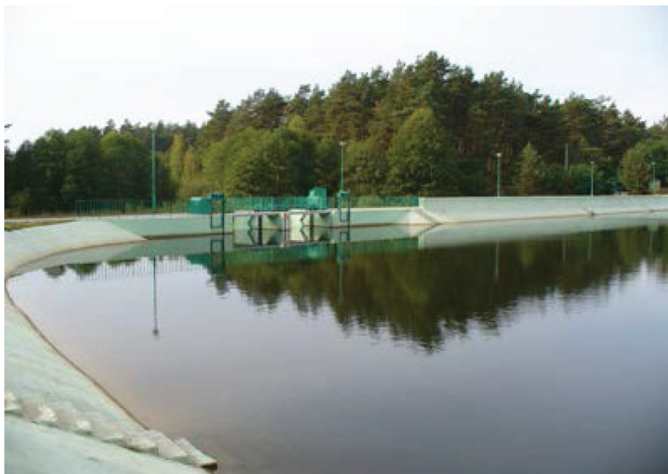
Fotografia 7. Zbiornik Majdan Sopocki o objętości 338 tys. m 3 .