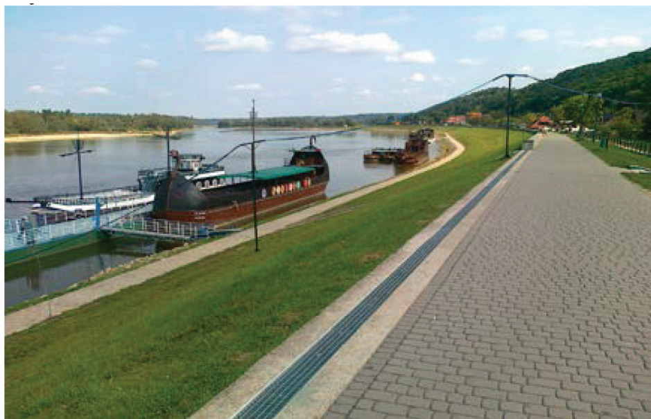
Fotografia 11. Parapet rozbieralny na dł. 0,870 km, przekazany do użytkowania w latach 2001 – 2006.