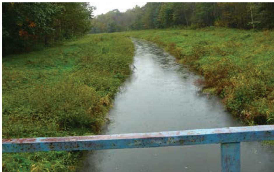
Fotografia 1. Odcinek nawadniający Kanału Wieprz – Krzna w km 65+680 w rejonie rzeki Piwonia