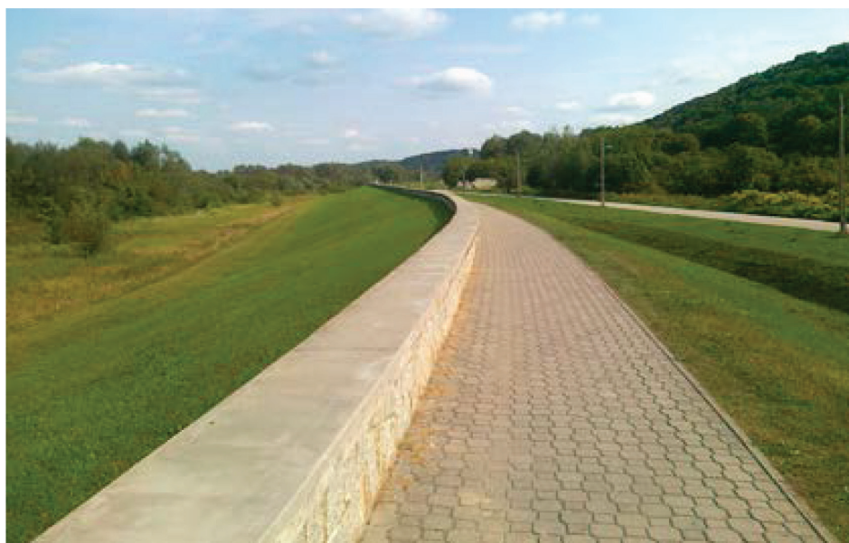
Fotografia 12. Parapet stały o długości 3,155 km w koronie wału w Kazimierzu Dolnym, oddany do użytkowania w latach 2001 – 2006.