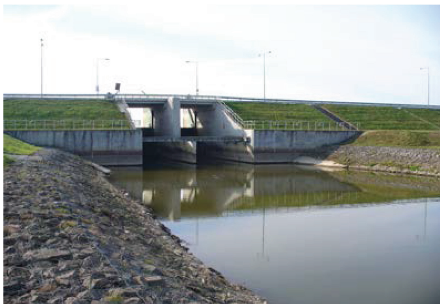
Fotografia 10. Jaz zapory głównej zbiornika Nielisz, przekazanego do użytkowania w 2008 r.