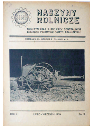
Okladka drugiego numeru „Maszyn Rolniczych”