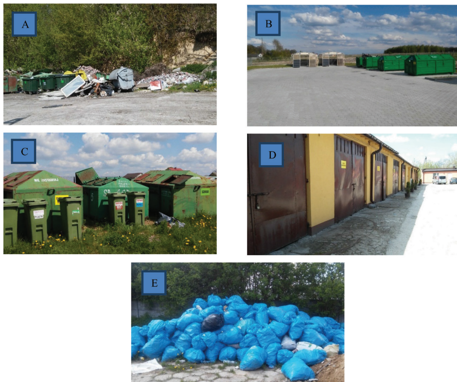
Fotografie / Photo: Jabłczyńska, 2017