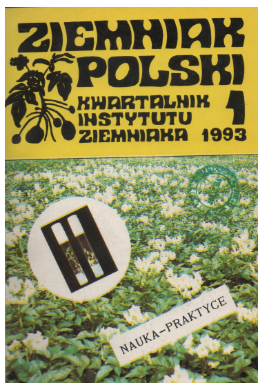
Jeszcze format A5

Zmieniła się też szata graficzna pisma. W 1993 r. wystartowaliśmy z kolorową okładką, od drugiego numeru 1996 r. skład był już komputerowy, w 2004 r. przeszliśmy na format A4, dzięki czemu poprawiła się czytelność druku i można było zwiększyć liczbę publikowanych artykułów. Stopniowo wprowadzaliśmy kolor wewnątrz numeru.