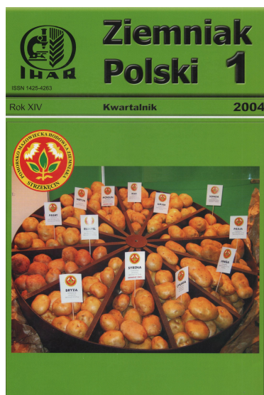
A tu już format A4

W tym samym roku została powołana składająca się z wybitnych specjalistów w branży rada programowa czasopisma. Wprowadziliśmy też wyraźny podział na działy tematyczne: genetyka i hodowla, nasiennictwo i odmianoznawstwo, agrotechnika i mechanizacja, ochrona, przechowywanie i przetwórstwo, ekonomika i rynek, makroproblemy branży.